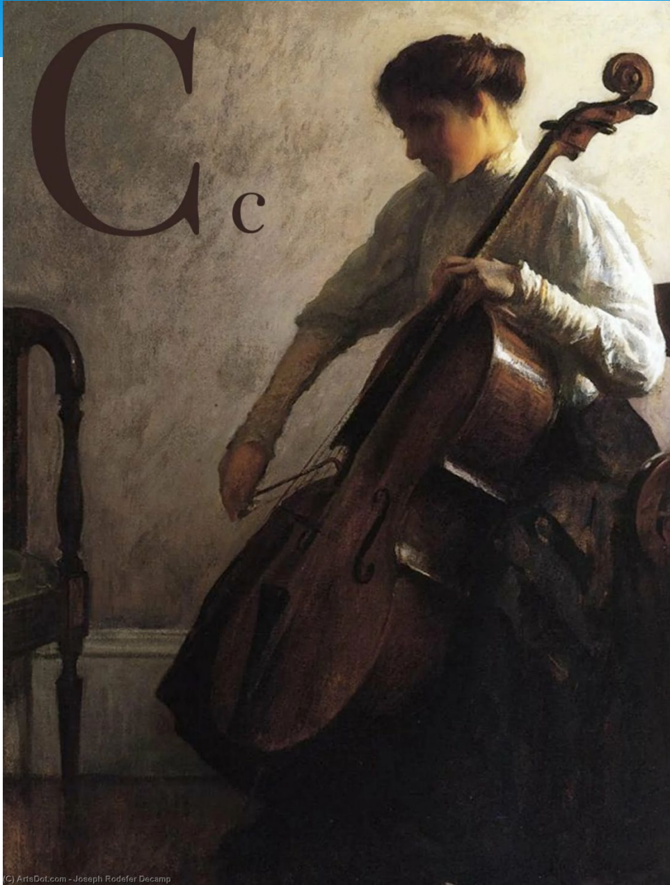
C) ArtsDot.com - Joseph Rodéfer Decamp