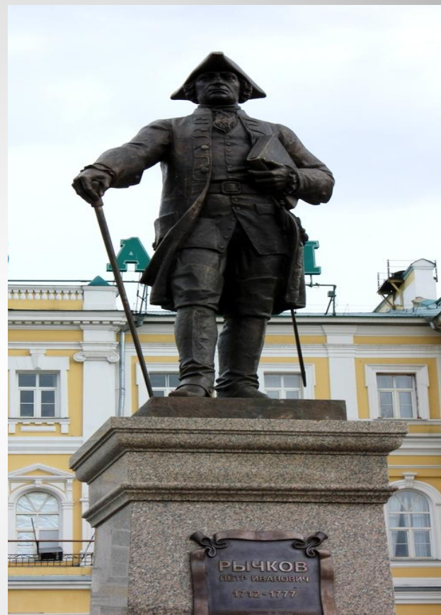
Памятники П.И.Рычкову в городе Оренбурге