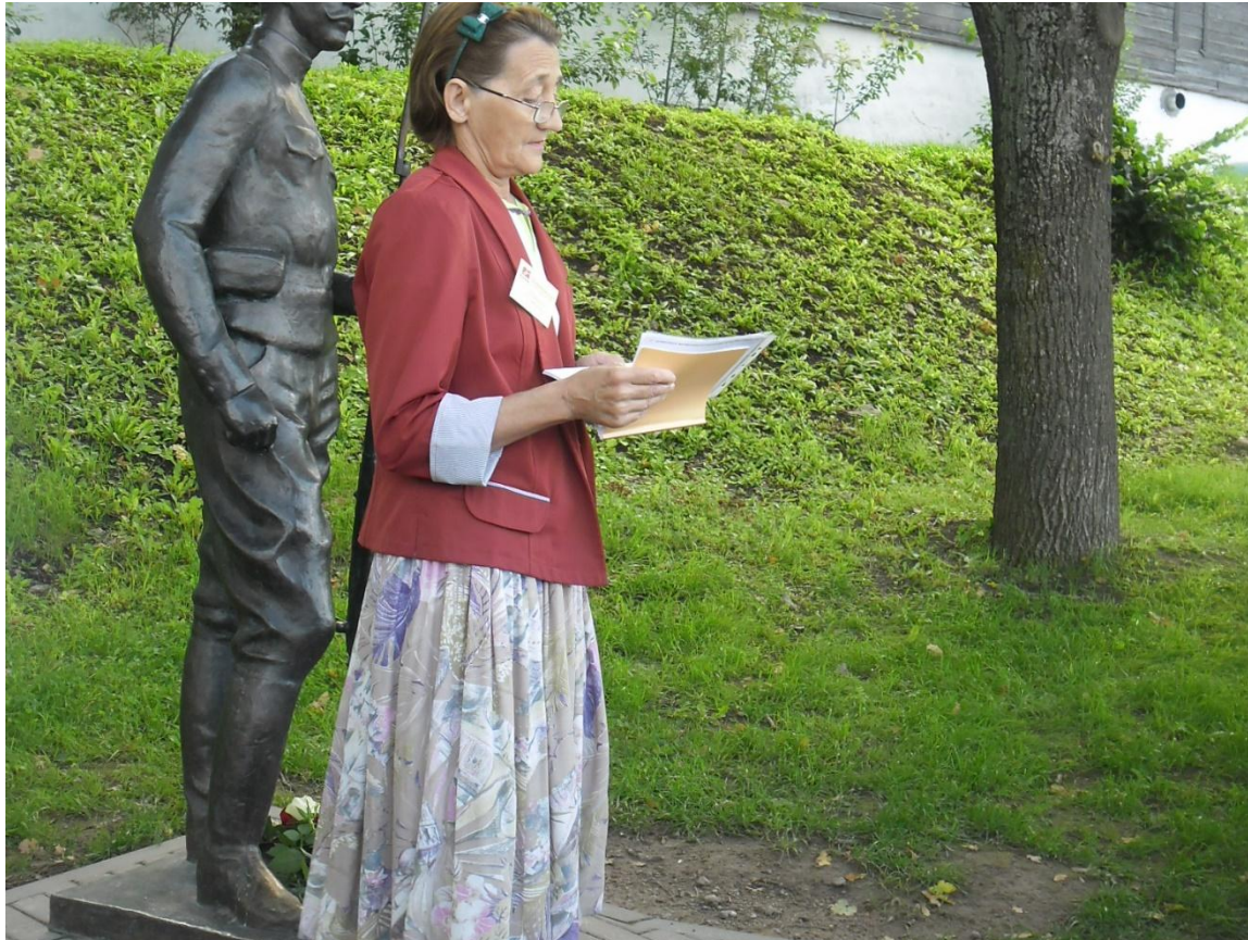
памятника Солдату Первой мировой войны в Пскове