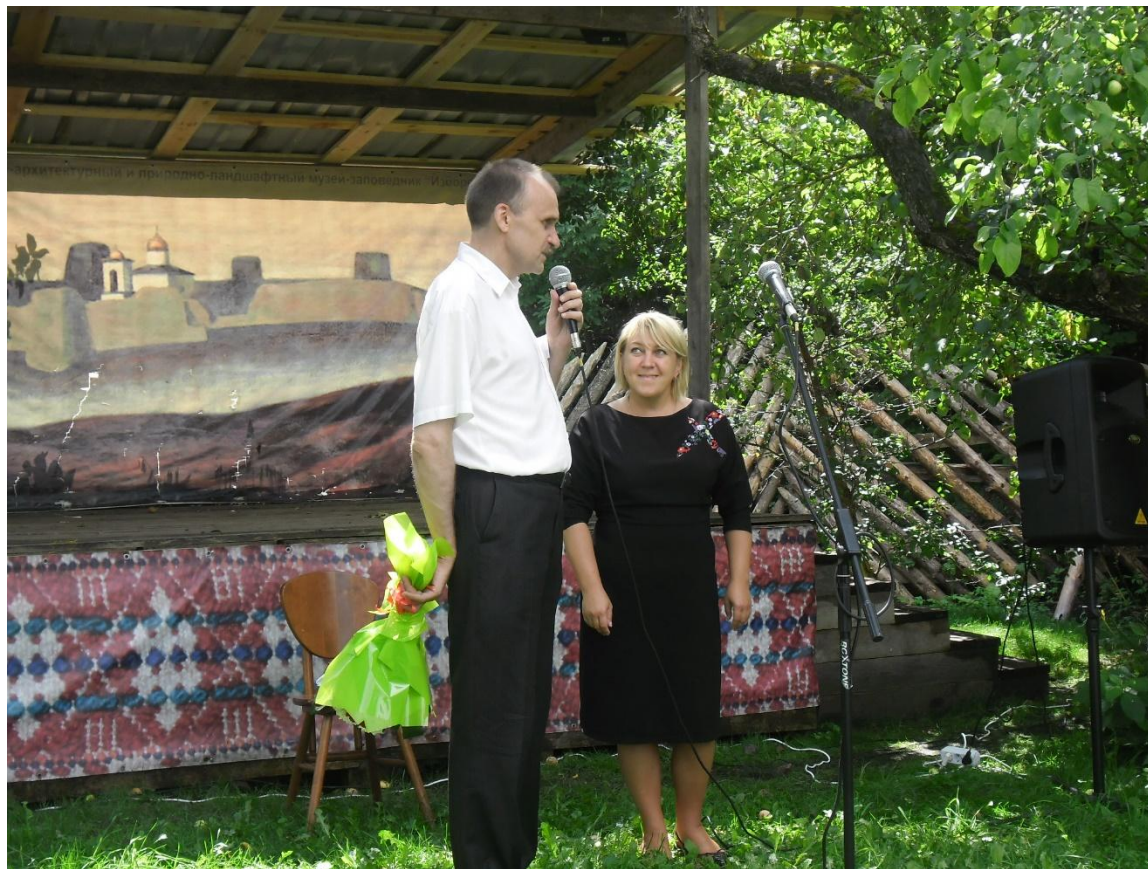
Цветы и слова благодарности – директору музея