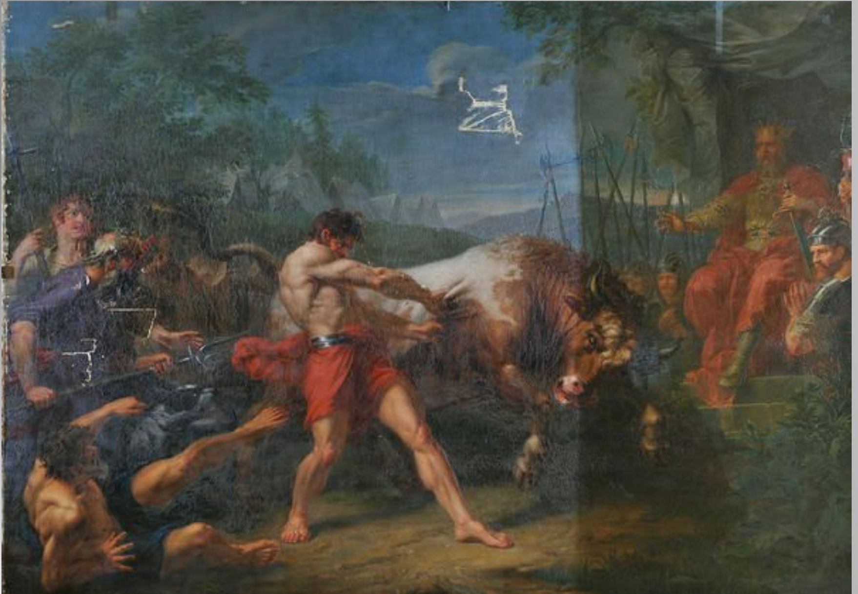
В процессе реставрации. Фото 2014 года.