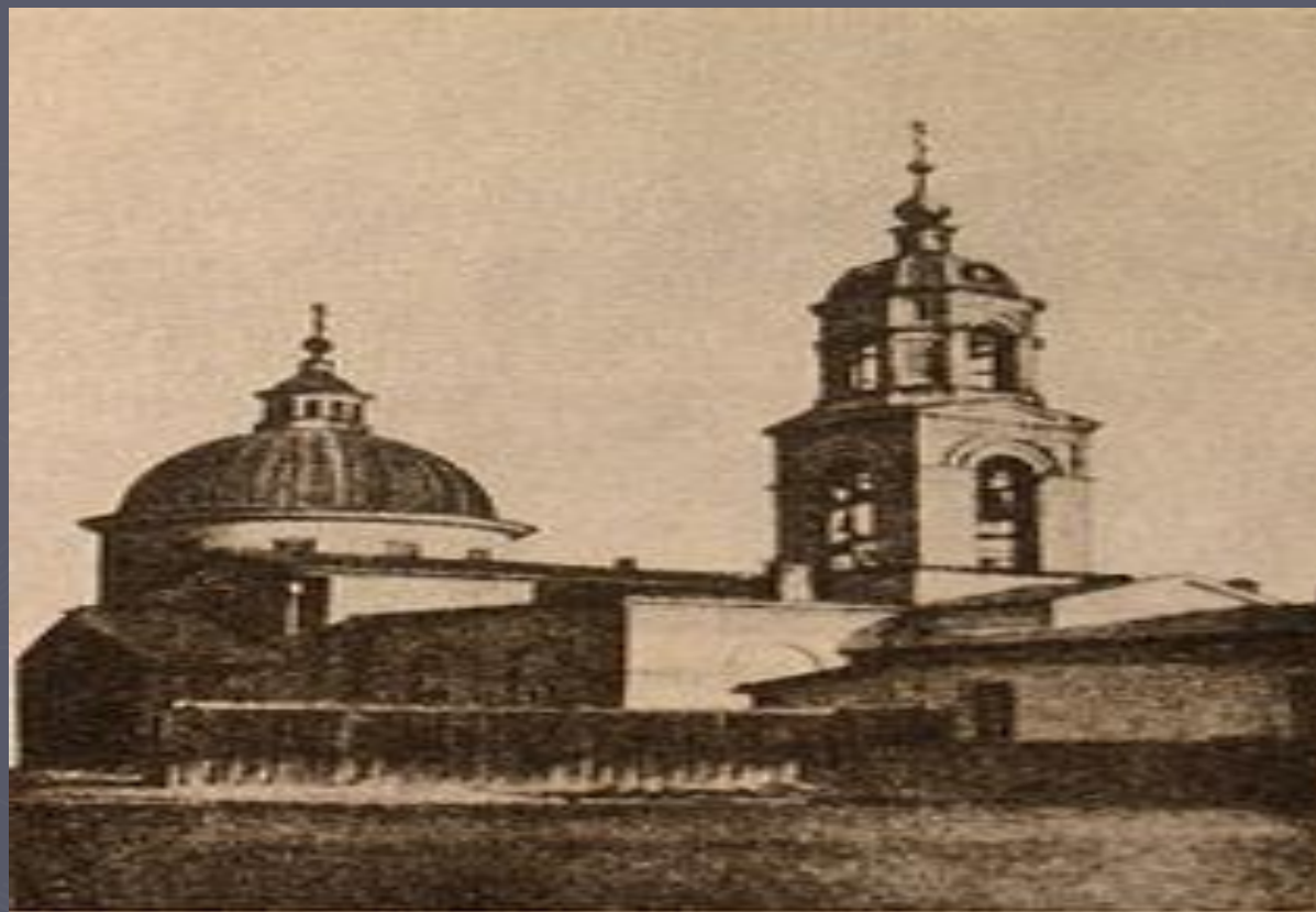
Старая Благовѣщенская церковь, построенная въ XVIII в.