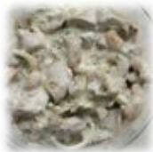
Сола тшак (грибы соленые со сметаной)