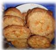
Шыдеса шаньга (шаньги с крупой)