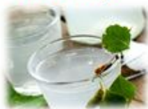
Зарава (березовый сок)