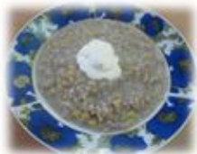
«Шома шыд» (кислый суп)