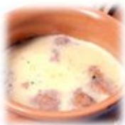
Йола кукань яй (телятина в молоке)