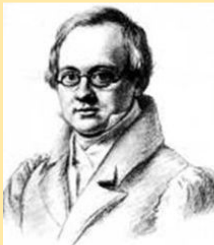
АНТОН АНТОНОВИЧ ДЕЛЬВИГ