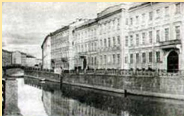
Квартира Пушкина в Петербурге на Набережной Мойки.

В середине октября 1831 г. и уже до конца жизни Пушкин с семьей живет в Петербурге.