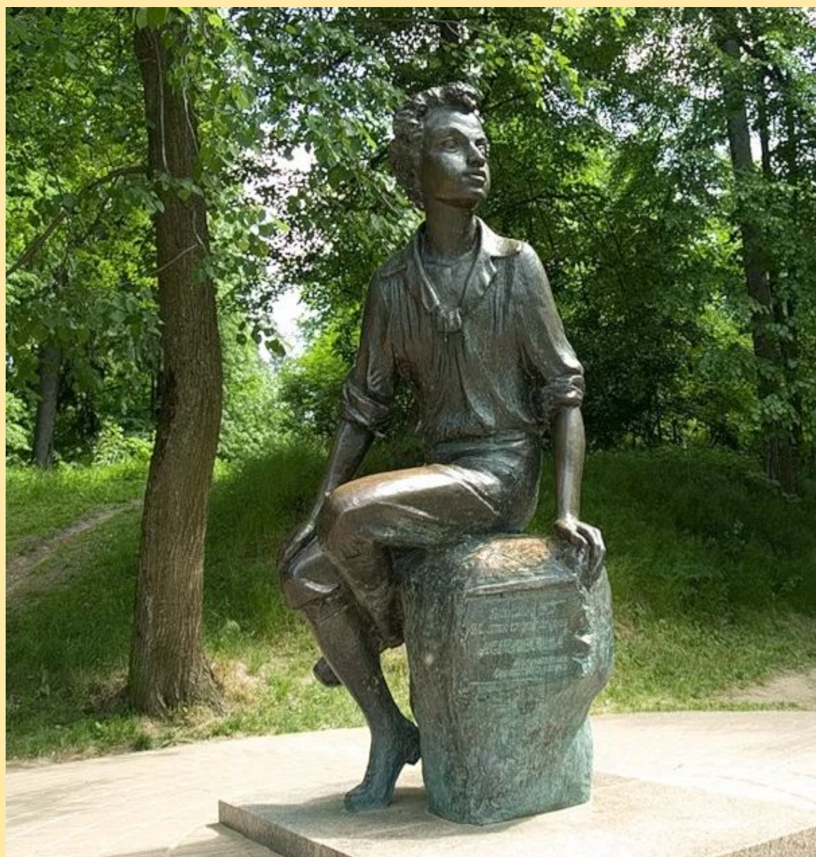
Памятник А.С. Пушкину в Захарове. Скульптор А. Хижняк