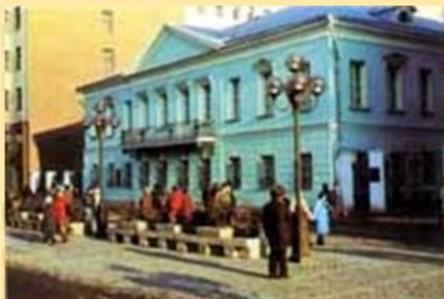
Квартира Пушкина в Москве на Арбате.