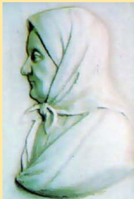
Яковлева Арина Родионовна

Любовь в родном языке маленькому Пушкину привила бабушка, Мария Алексеевна Ганнибал, превосходно говорившая и писавшая по- русски, и няня Арина Родионовна.