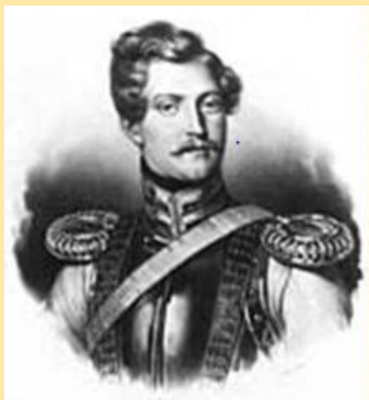
Ж. Дантес- Геккерн. 1830 гг.

В начале 1834 г. в Петербурге появился француз барон Дантес. Он влюбился в жену Пушкина и стал за ней ухаживать.