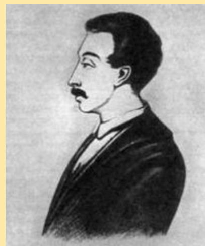
Вильгельм Карлович Кюхельбеке р

Пушкин сохранил лицейскую дружбу и культ Лицея на всю жизнь.