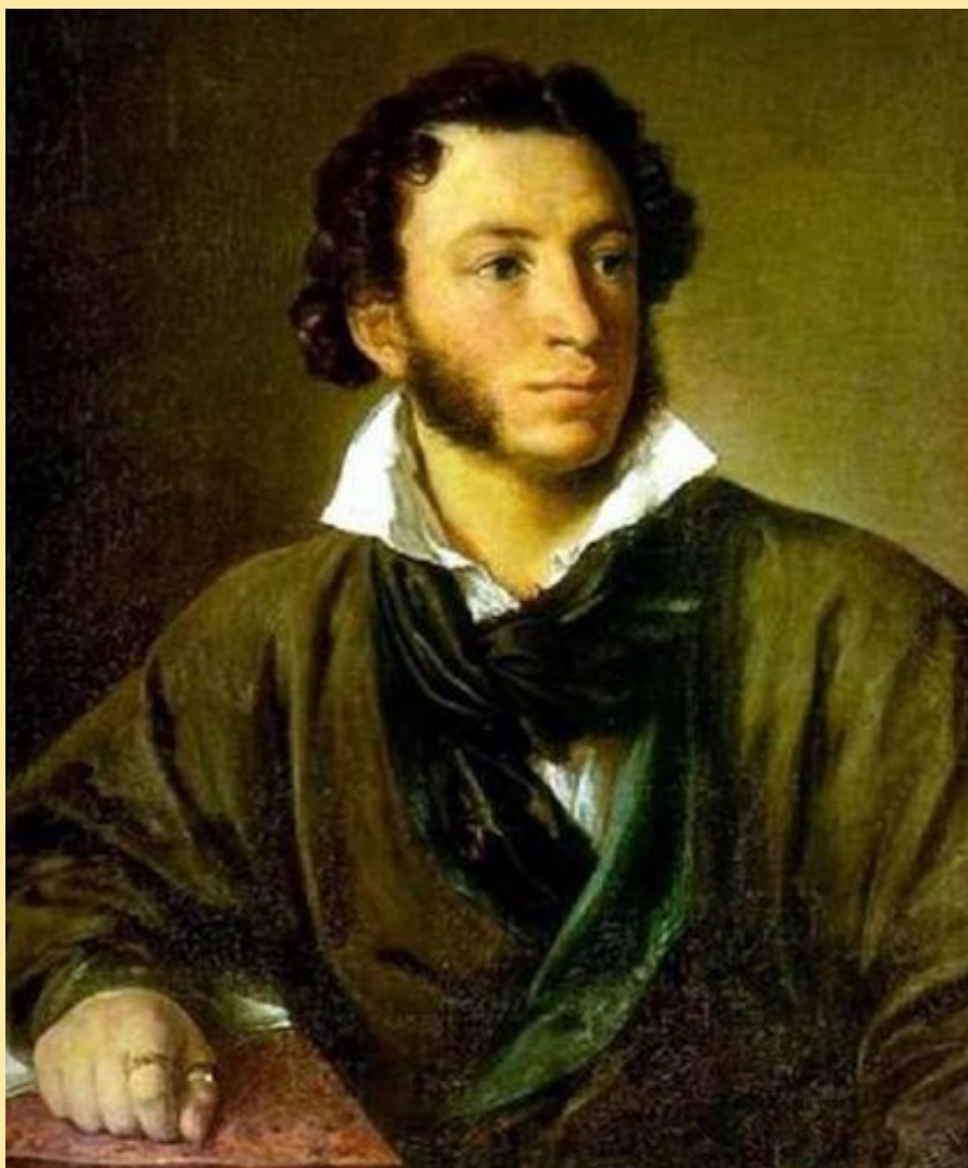
Пушкин Александр Сергеевич 1799-1837