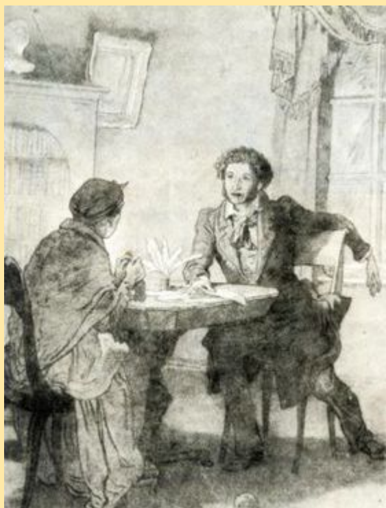
Иллюстрация к стихотворению «Зимний вечер»

...Наша ветхая лачужка И печальна и темна. Что же ты, моя старушка, Приумолкла у окна? Или бури завываньем Ты, мой друг утомлена, Или дремлешь под жужжаньем Своего веретена? Выпьем, добрая подружка Бедной юности моей, Выпьем с горя; где же кружка? Сердцу будет веселей. Спой мне песню, как синица Тихо за морем жила; Спой мне песню как девица За водой по утру шла.