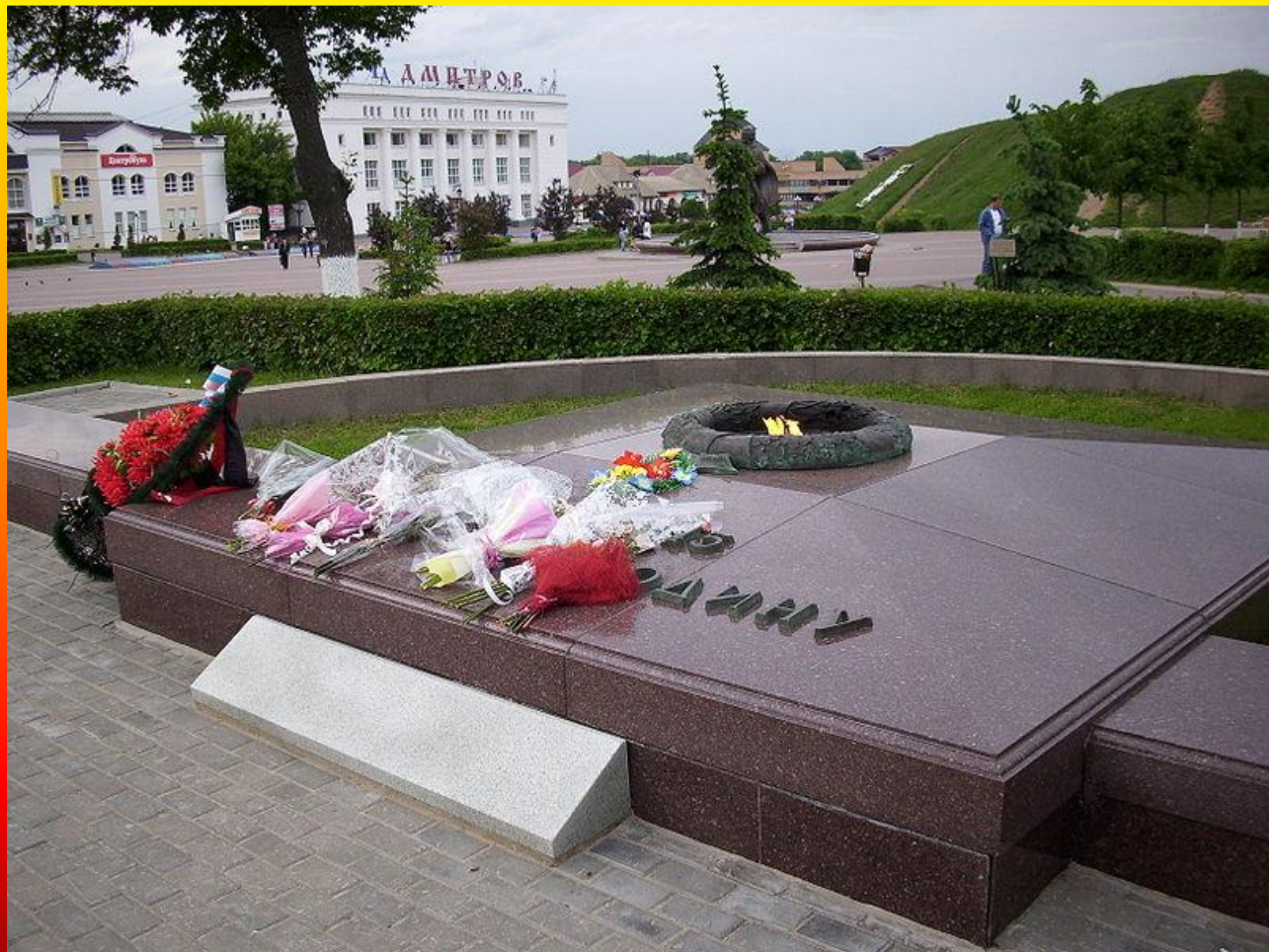
Вечный огонь в г.Дмитрове