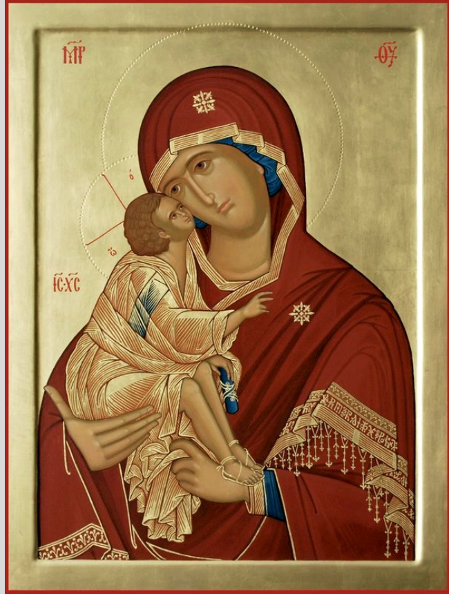
Донская икона Божией Матери