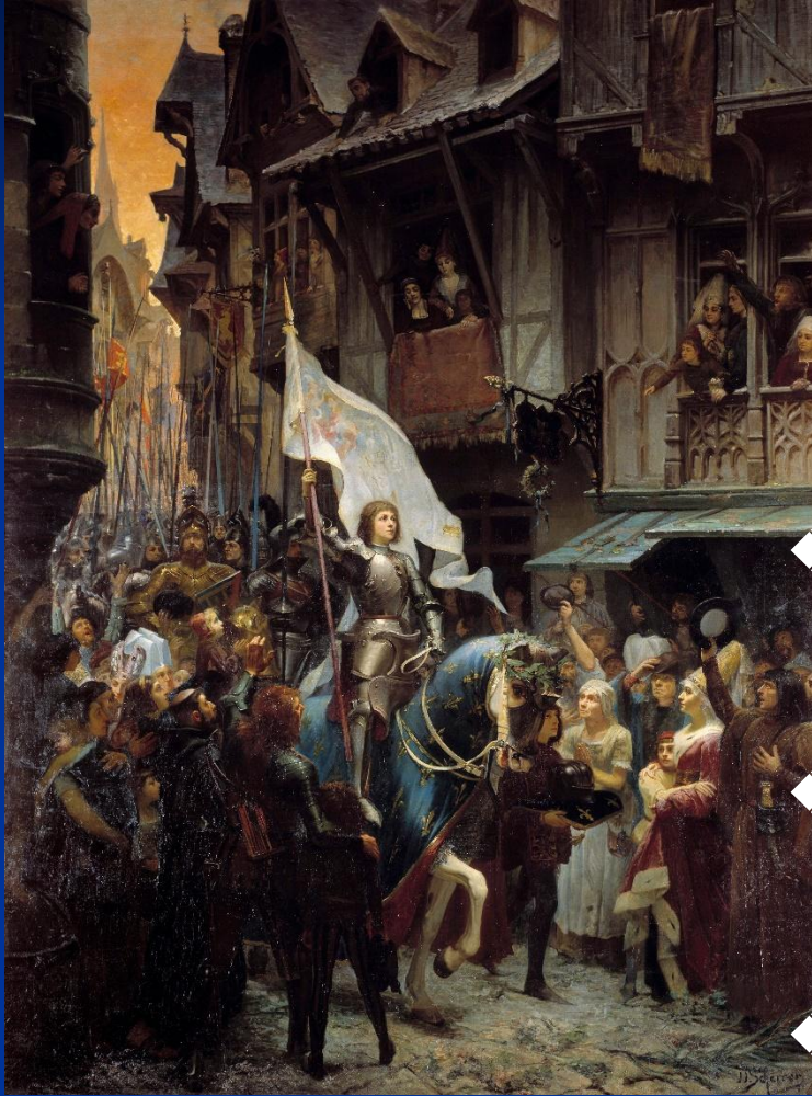
Ж.Шеррер. Въезд Жанны д'Арк в Орлеан

Жанна д'Арк – крестьянка из Домреми, героиня Франции