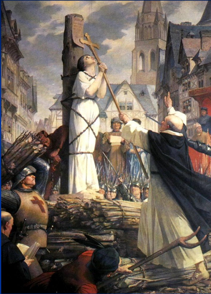
Ж.Ленева. Казнь Жанны д'Арк.

1431 – суд и казнь Жанны д'Арк по обвинению в ереси