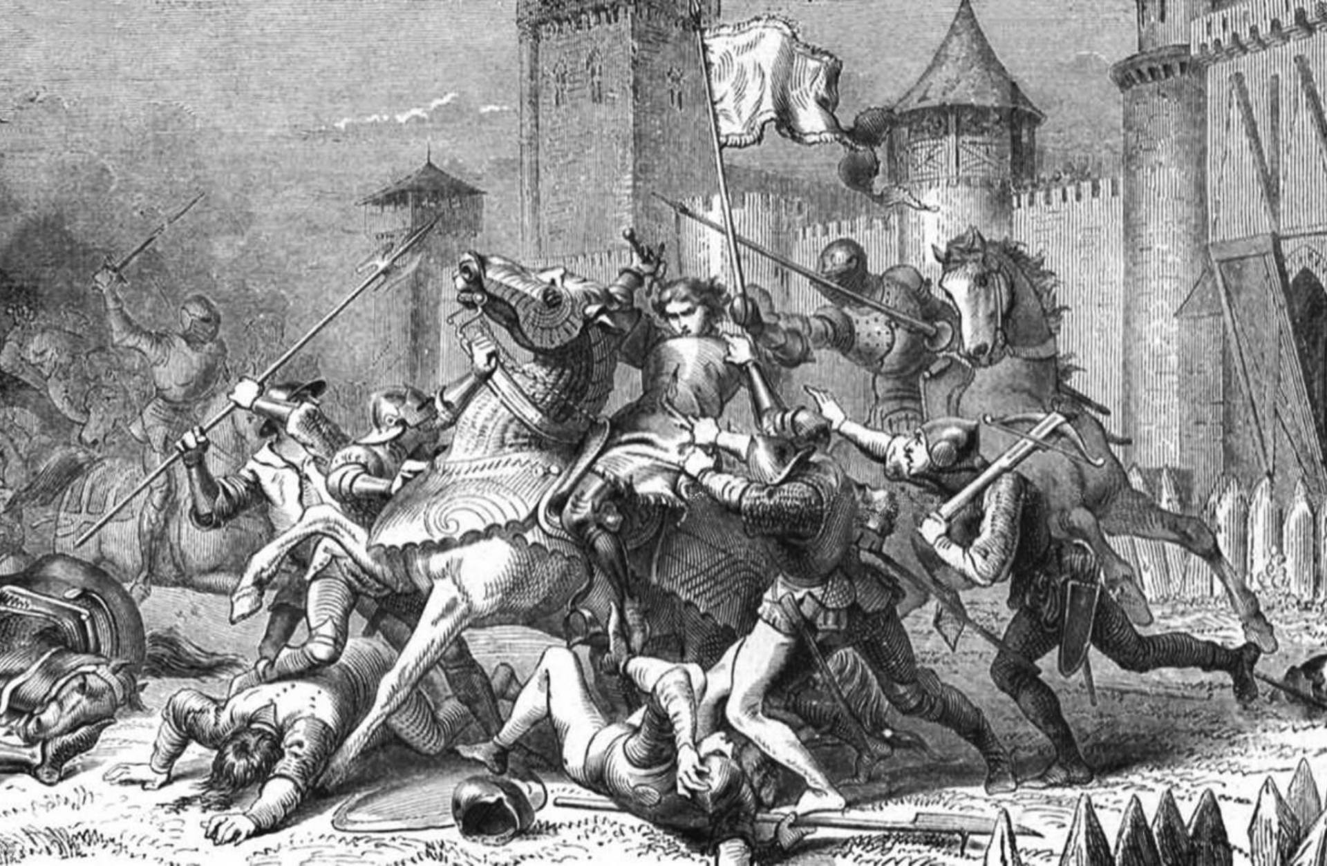
Взятие в плен Жанны д'Арк под Компьеном. Гравюра XIX в.