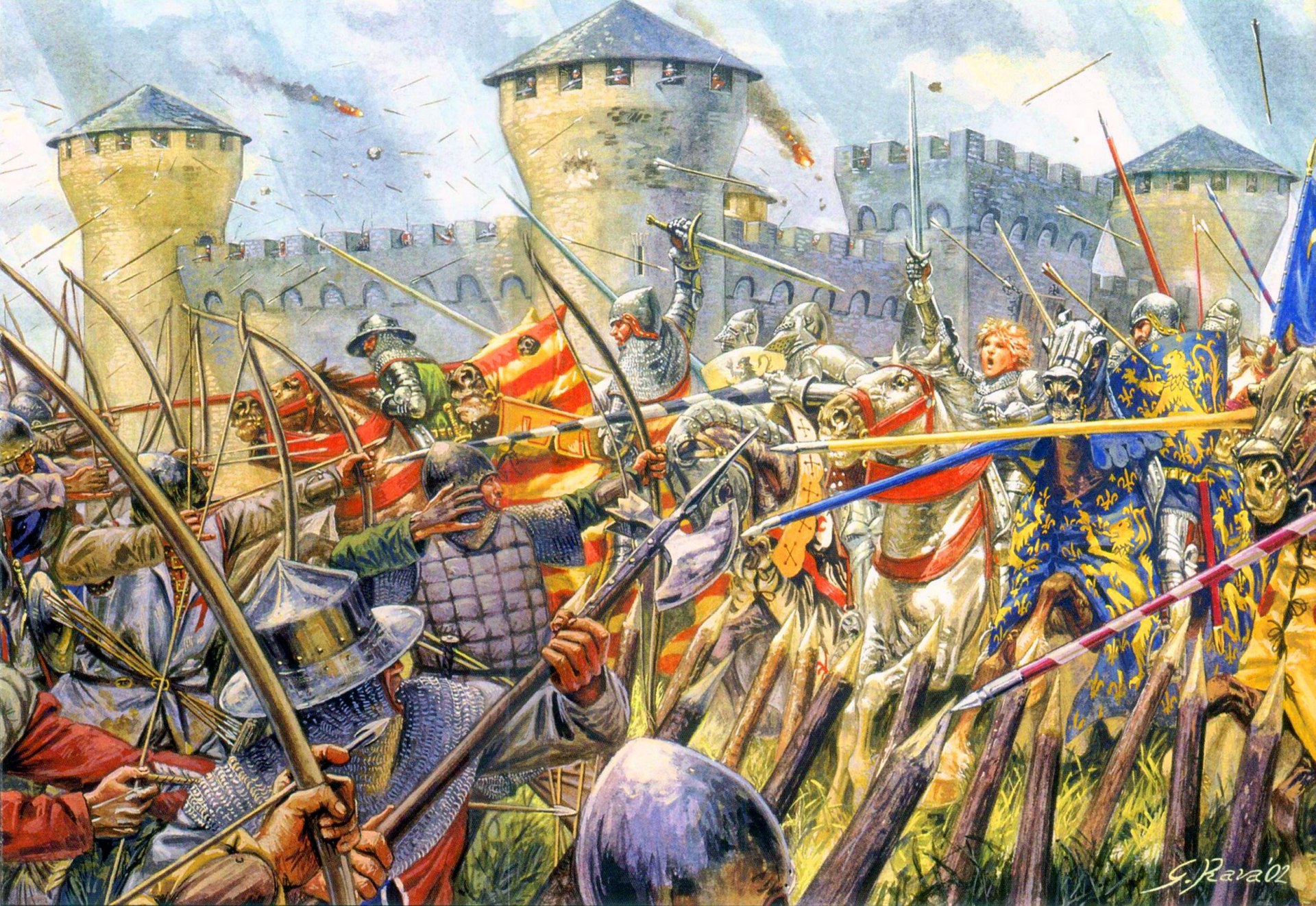
Атака Жанны д'Арк под Орлеаном. Рисунок