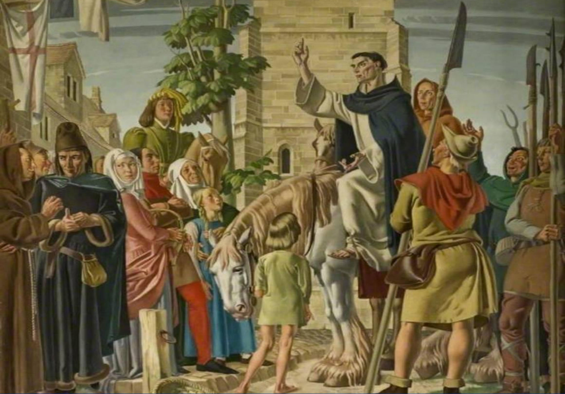
Проповедь Джона Болла. Рисунок