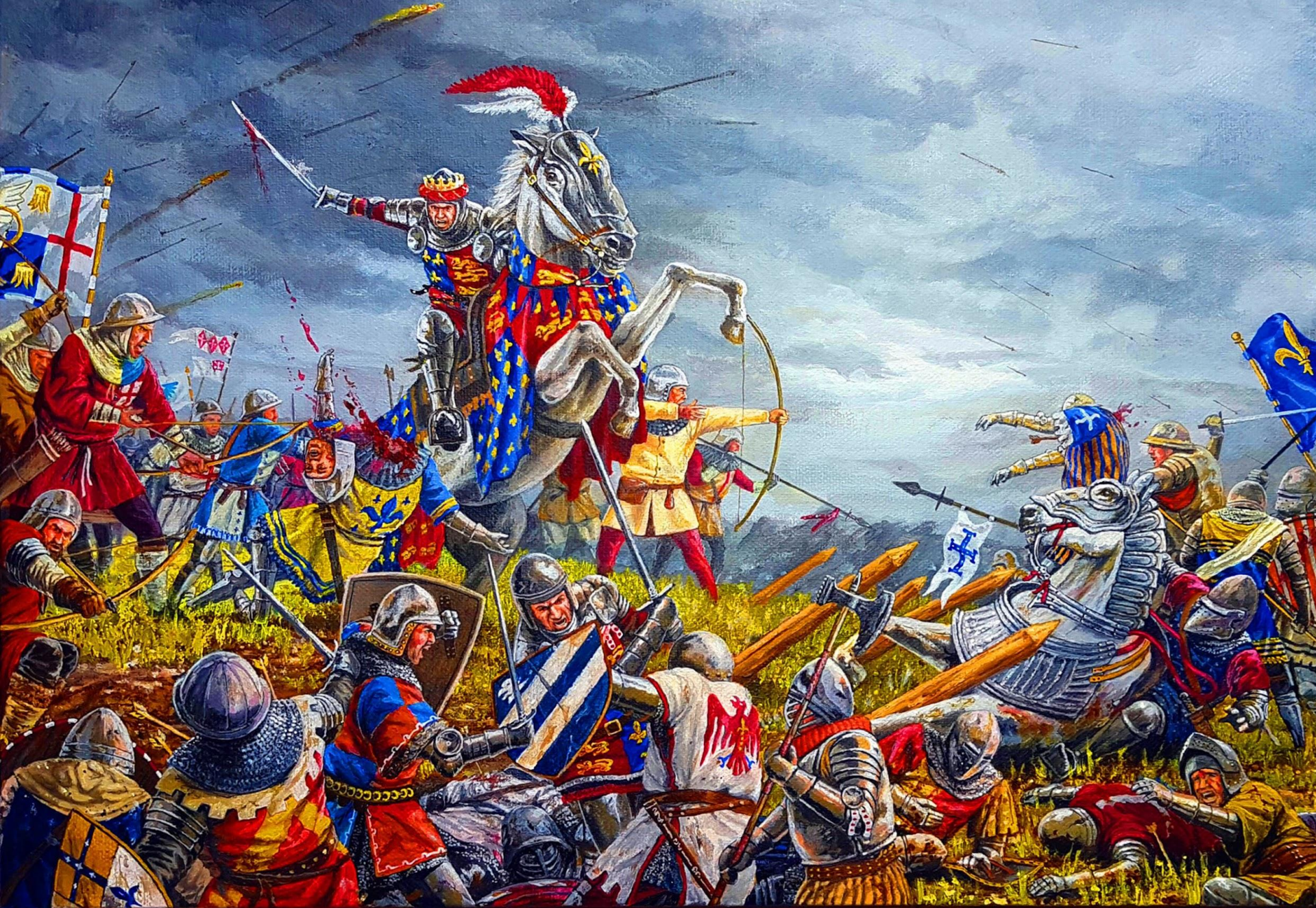
Битва при Азенкуре. Рисунок