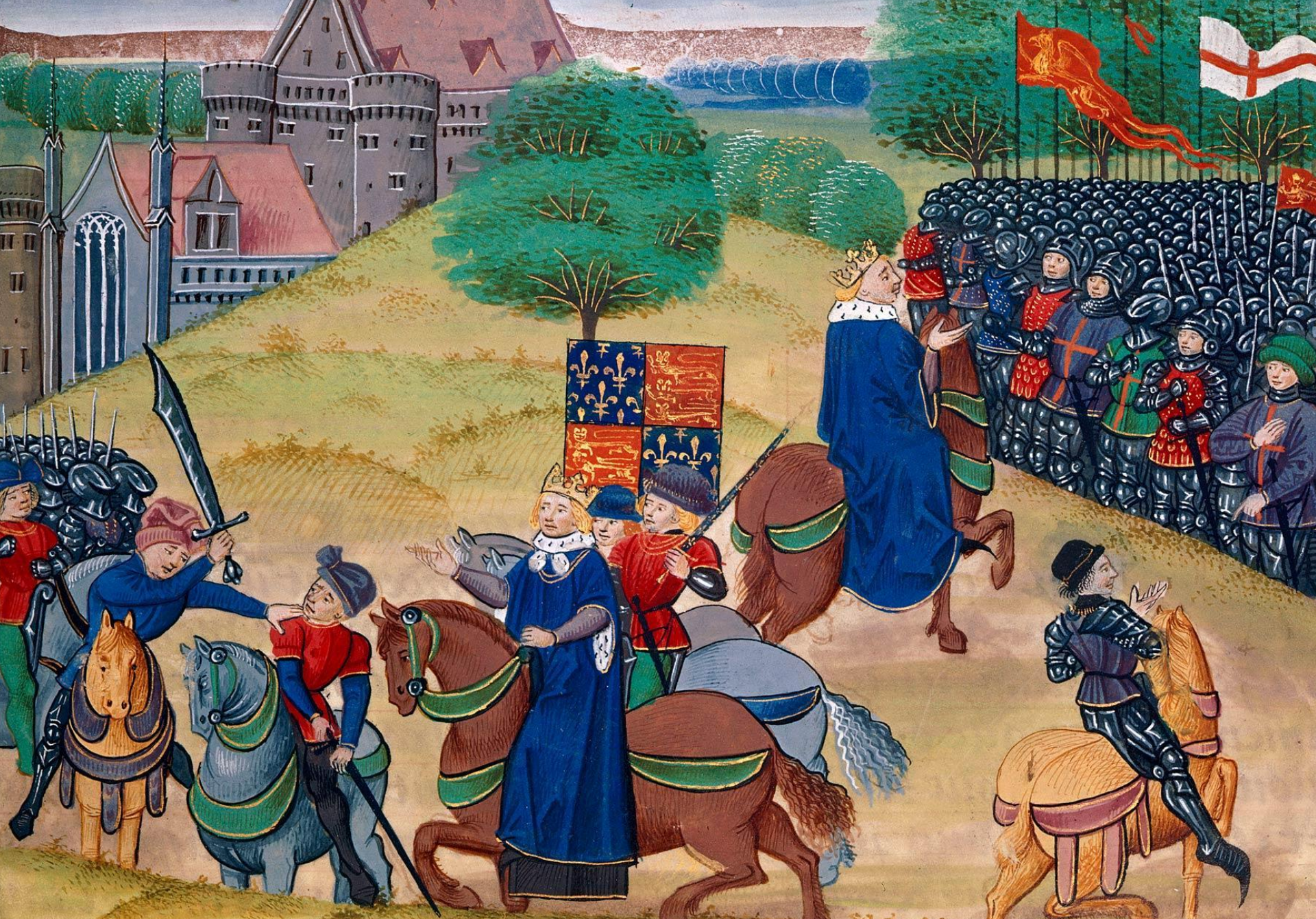
Убийство Уота Тайлера. Средневековая миниатюра