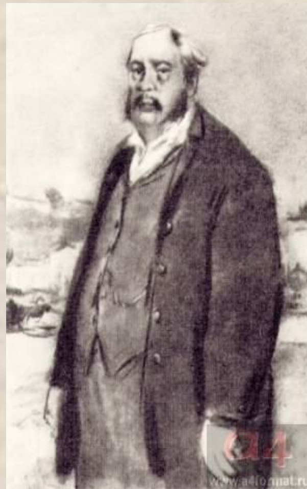
Николай Петрович Кирсанов

И.С.Тургенев писал о том, что ему близка личность и судьба Николая Петровича Кирсанова: « Николай Петрович – это я, Огарев и многие другие ». Вместе с тем писатель признавал неспособность подобных людей на решительные поступки, поэтому он вывел на страницы романа представителя другого поколения и других взглядов.