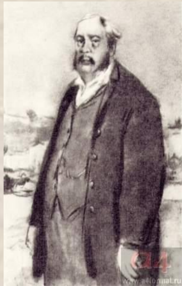
Николай Петрович Кирсанов

И.С.Тургенев писал о том, что ему близка личность и судьба Николая Петровича Кирсанова: « Николай Петрович – это я, Огарев и многие другие ». Вместе с тем писатель признавал неспособность подобных людей на решительные поступки, поэтому он вывел на страницы романа представителя другого поколения и других взглядов.