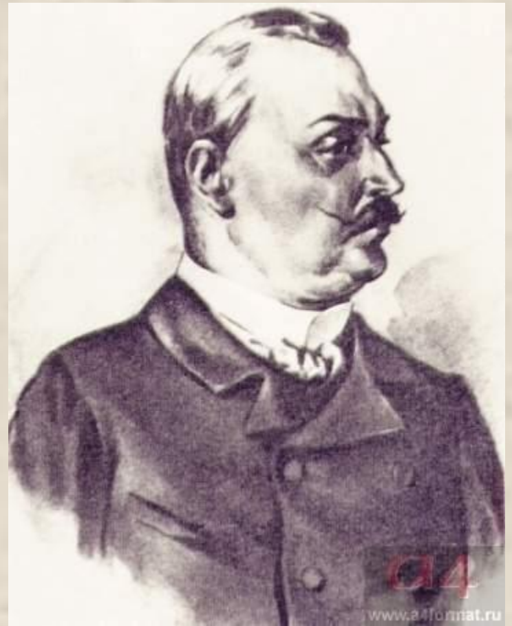
Павел Петрович Кирсанов.

Павел Петрович видит в аристократии основную общественную силу. Её представители, утверждает он, обладают исключительным чувством собственного достоинства. Базаров с ним не согласен. По его мнению, аристократы ничего не делают и, следовательно, не приносят никакой пользы обществу.