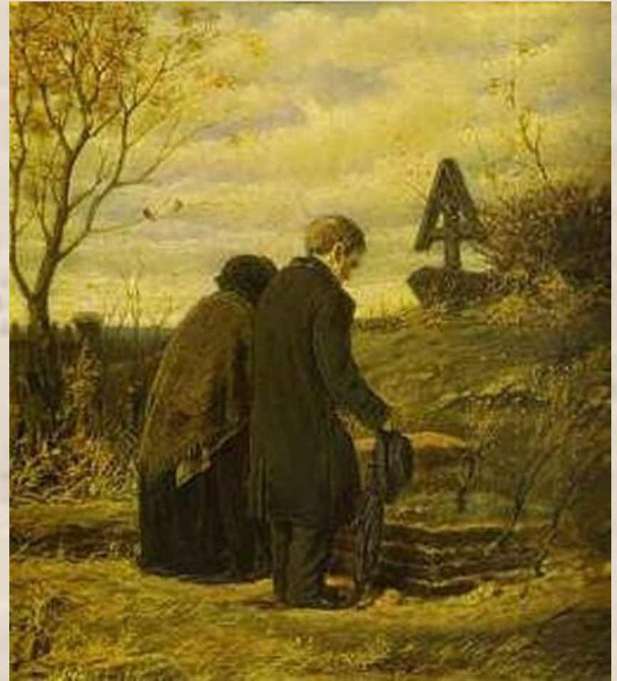
Старики-родители на могиле сына

Родители Базарова хорошие люди. Они готовы исполнить любое желание сына. Тем не менее, герой чувствует себя дома неловко. На примере семьи Базаровых И.С.Тургенев показывает конфликт поколений на сломе эпох: между родителями и сыном есть любовь, уважение, но нет взаимопонимания.