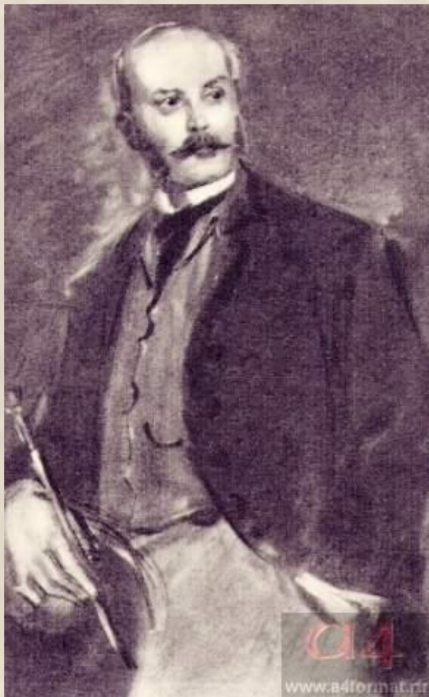
Павел Петрович Кирсанов.

Возлюбленная Павла Петровича уехала из России – он вышел в отставку, узнал о ее смерти – поселился в Марьино.