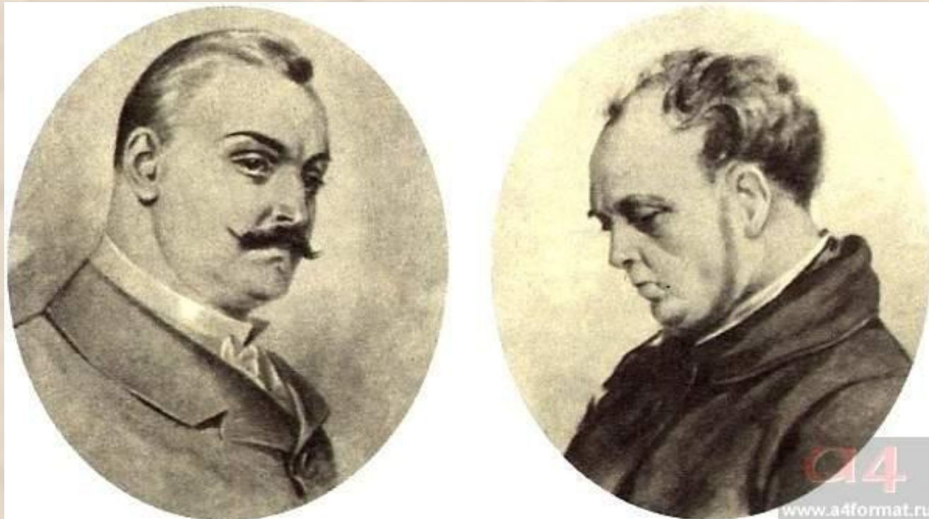
Павел Петрович и Николай Петрович Кирсановы.

Страницы романа, посвященные прошлому Николая Петровича и Павла Петровича Кирсановых, можно назвать обобщенной биографией «отцов». Очевидно, что их жизнь менялась в зависимости от внешних обстоятельств.