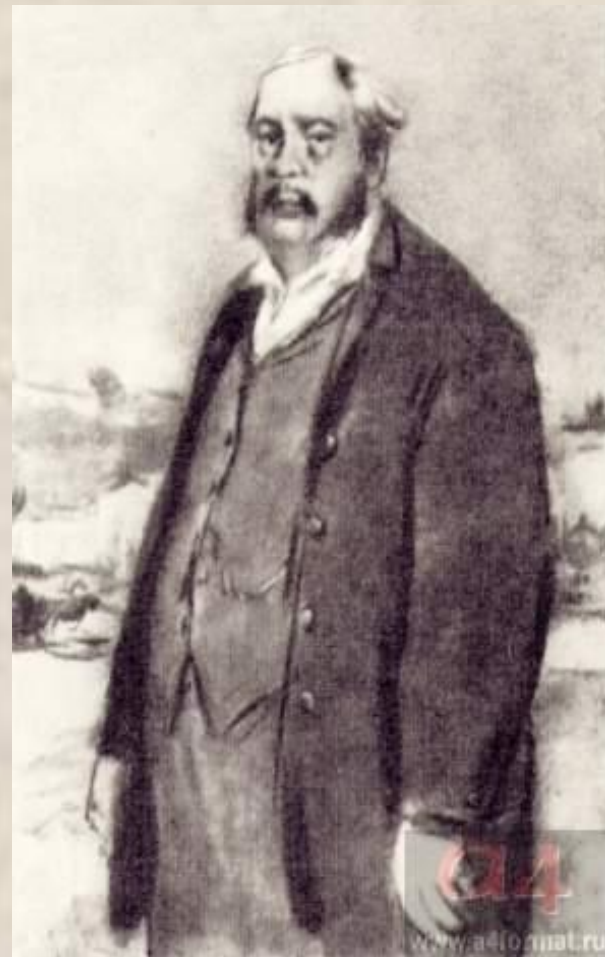
Николай Петрович Кирсанов

И.С.Тургенев писал о том, что ему близка личность и судьба Николая Петровича Кирсанова: «Николай Петрович – это я, Огарев и многие другие» . Вместе с тем писатель признавал неспособность подобных людей на решительные поступки, поэтому он вывел на страницы романа представителя другого поколения и других взглядов.