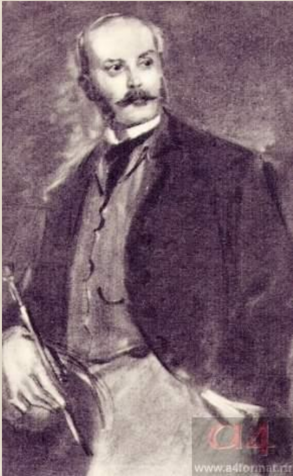
Павел Петрович Кирсанов.

Возлюбленная Павла Петровича уехала из России – он вышел в отставку, узнал о ее смерти – поселился в Марьино.