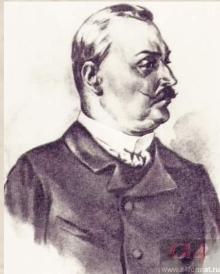
Павел Петрович Кирсанов.

Павел Петрович видит в аристократии основную общественную силу. Её представители, утверждает он, обладают исключительным чувством собственного достоинства. Базаров с ним не согласен. По его мнению, аристократы ничего не делают и, следовательно, не приносят никакой пользы обществу.