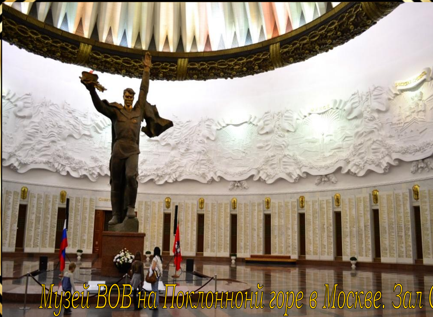
Музей ВОВ на Поклонной горе в Москве. Зал Славы