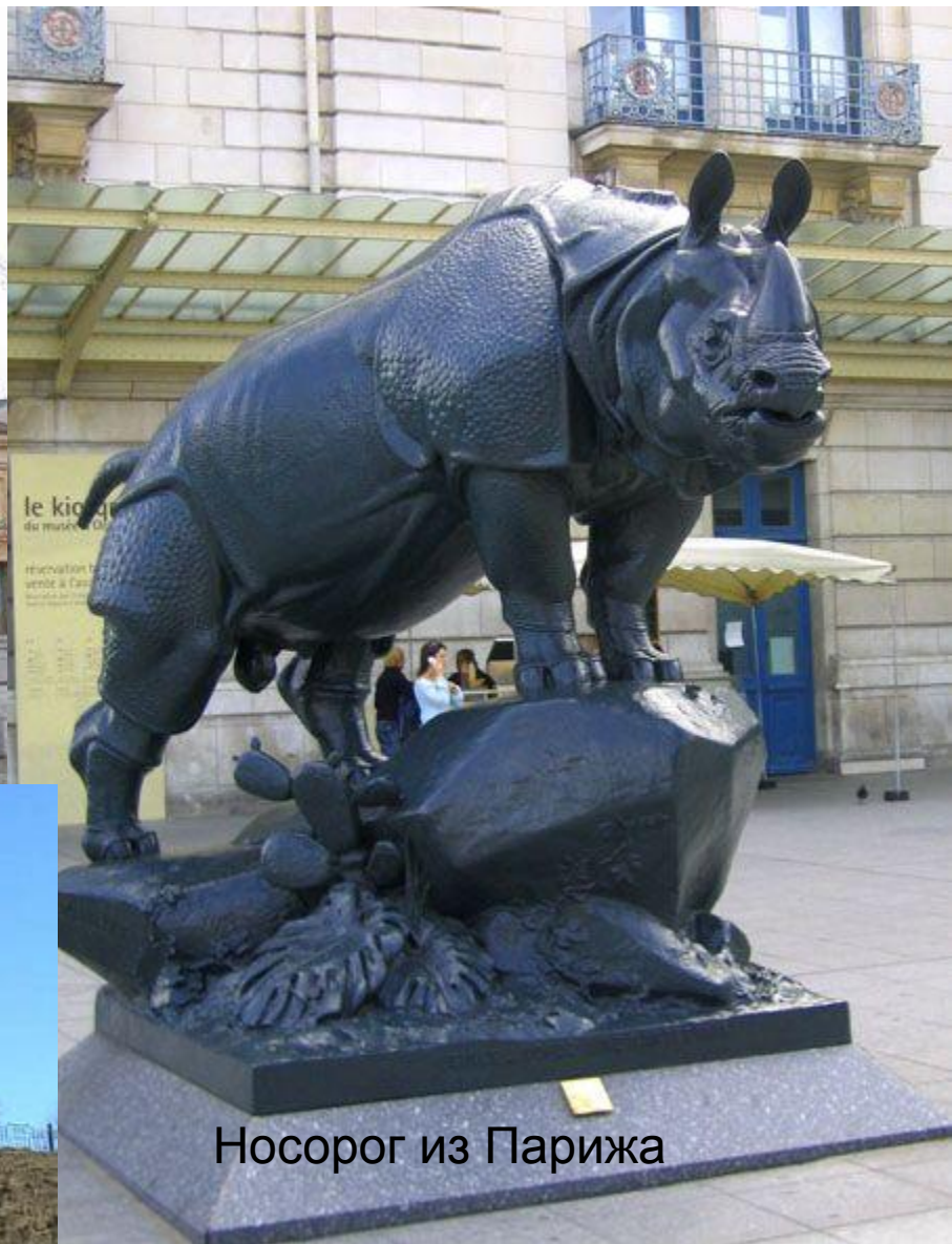
Носорог из Парижа