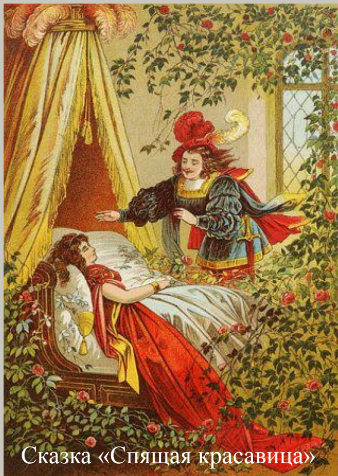
Сказка «Спящая красавица»

Такие времена действительно существовали – вплоть до XIV века женщины не знали, что такое ночной гардероб. Им приходилось спать в неудобной верхней одежде или нагими.