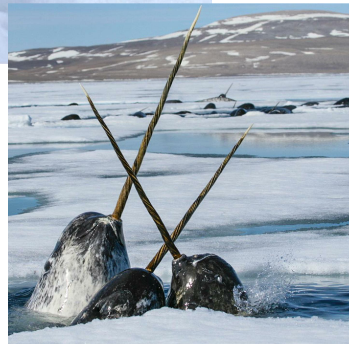
Нарвалы – морские единороги