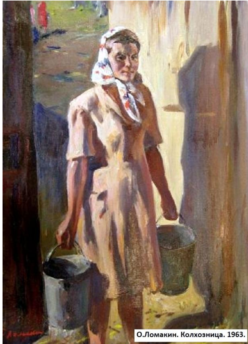
О.Ломакин. Колхозница. 1963.