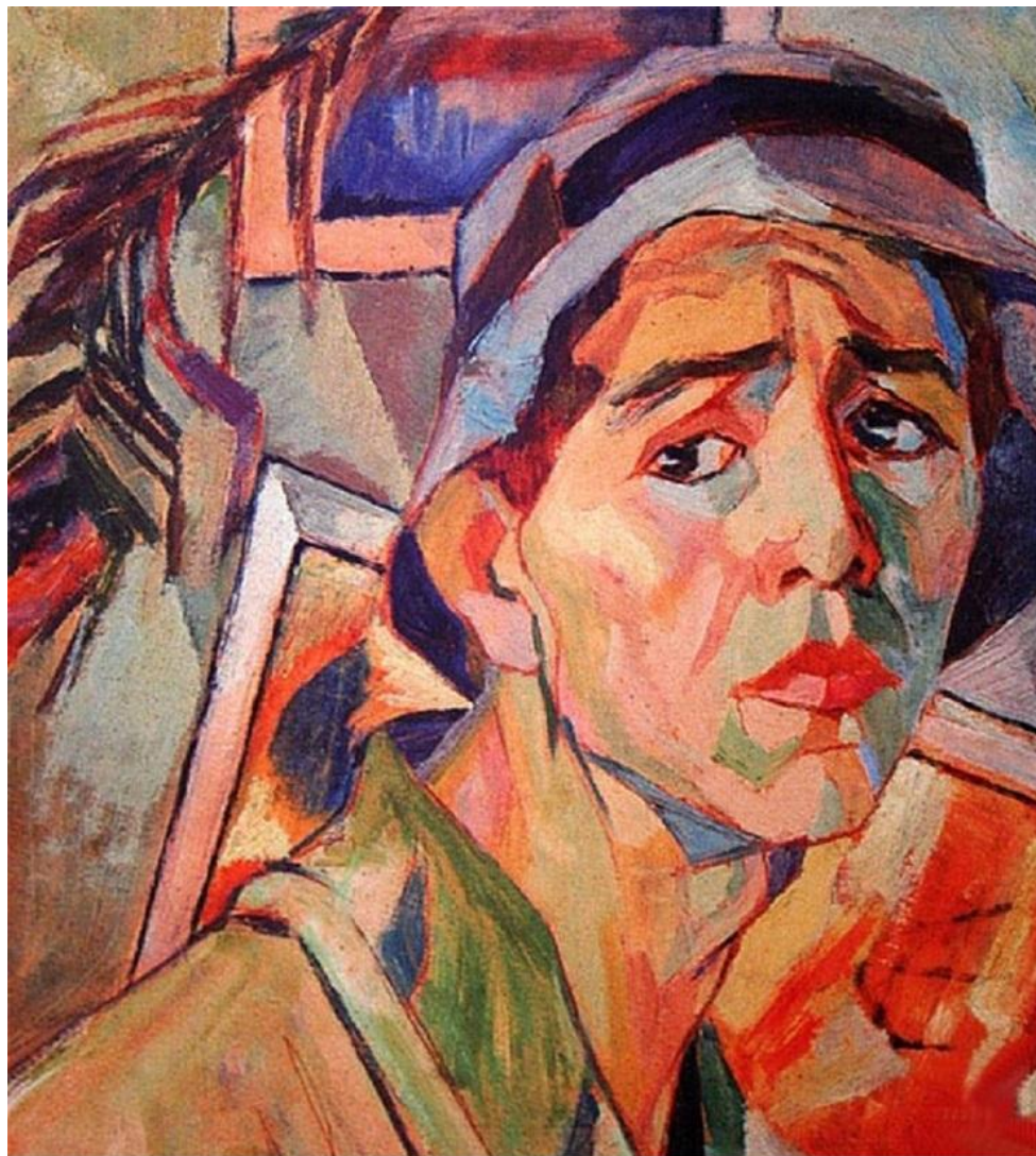
А.Дейнека. Автопортрет в панаме. 1920. Карт.галерея им.Дейнеки, Курск, Россия