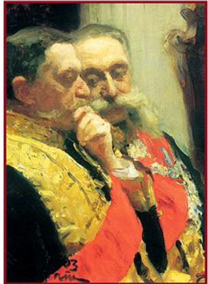
Александр Петрович Ольденбургский