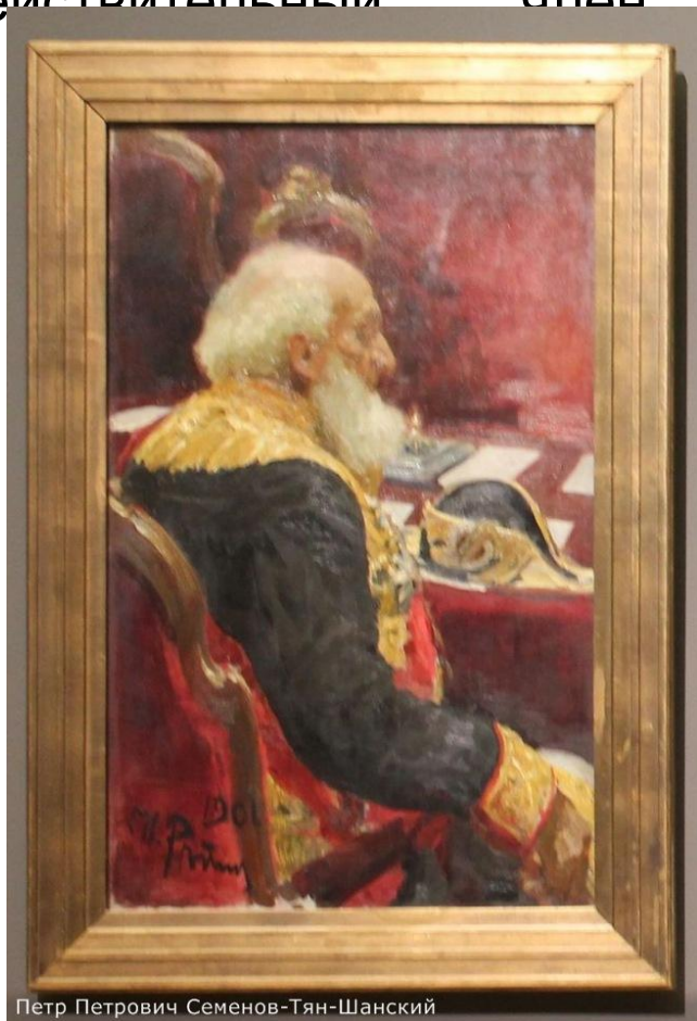
Петр Петрович Семенов-Тян-Шанский

Пётр Петрович Семёнов-Тян-Шанский (до мая 1906 года — Семёнов; 1827 — 1914) — русский географ, ботаник, статистик, экономист, государственный и общественный деятель. Вице-председатель Императорского Русского географического общества и президент Русского энтомологического общества, Почётный член: Императорской Академии наук и Академии художеств . Член Русского горного общества. Действительный член всех Российских университетов.