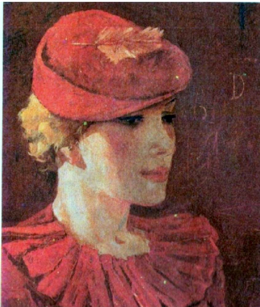
Александр Дейнека. Парижанка. 1935.