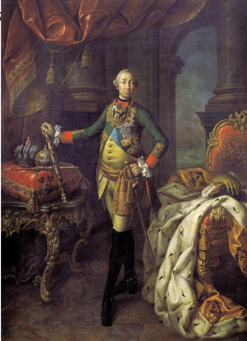
Александр I в 1812 г.