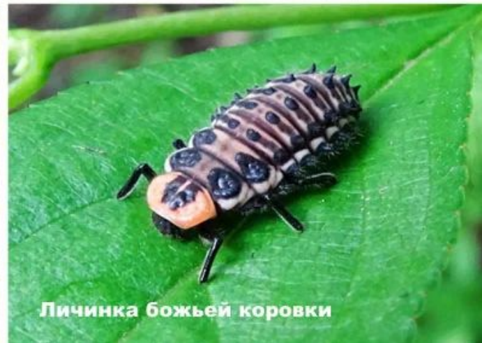
Личинка божьей коровки