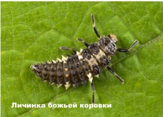
Личинка божьей коровки