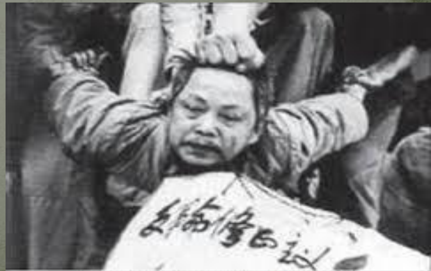
Методы «убеждения» во времена