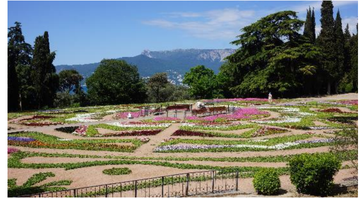
Ялта - Никитский сад