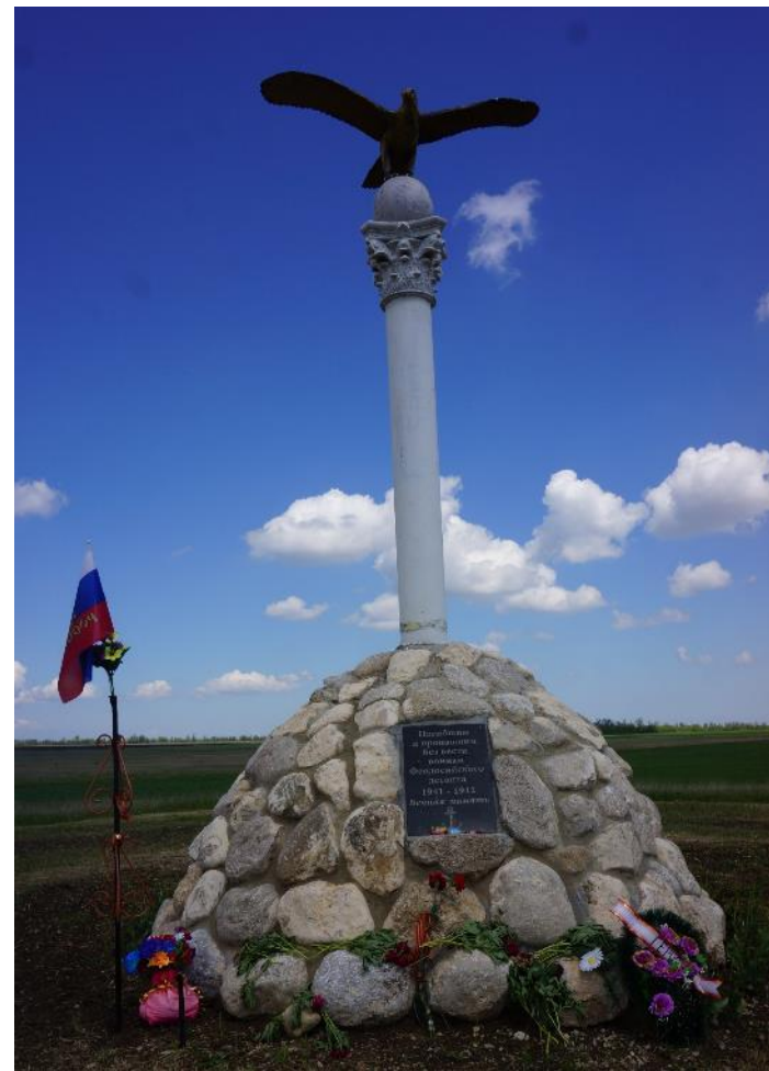
Памятник воинам Феодосийского десанта 1941-1942