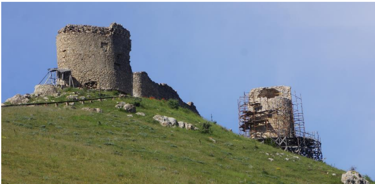
Чембало- Генуэзская крепость XIV век

Не только природой интересен Крым, но и богатой историей!