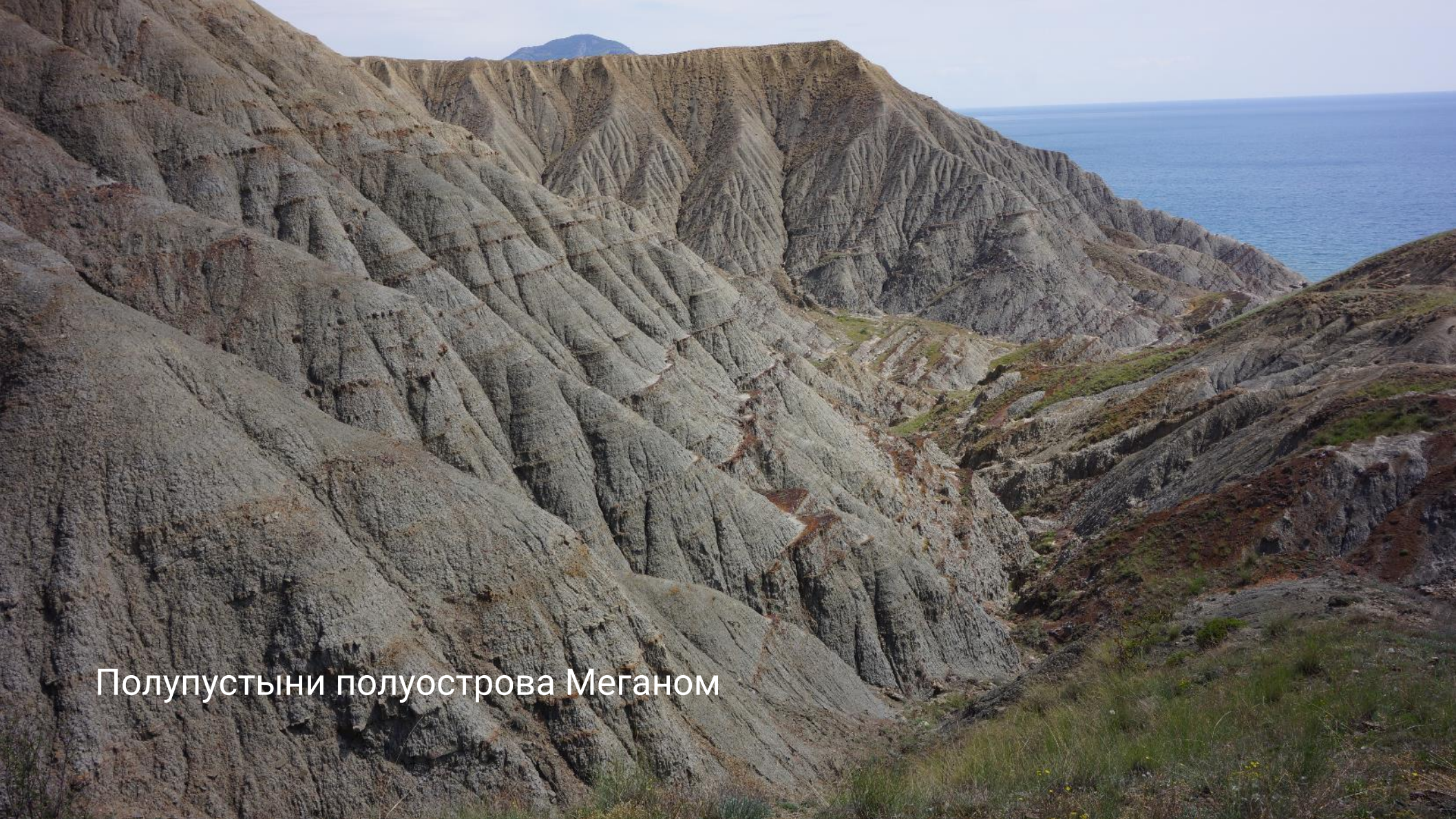
Полупустыни полуострова Меганом