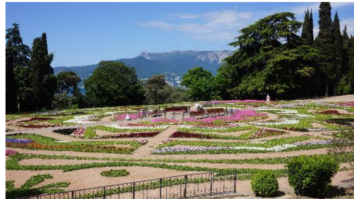
Ялта - Никитский сад