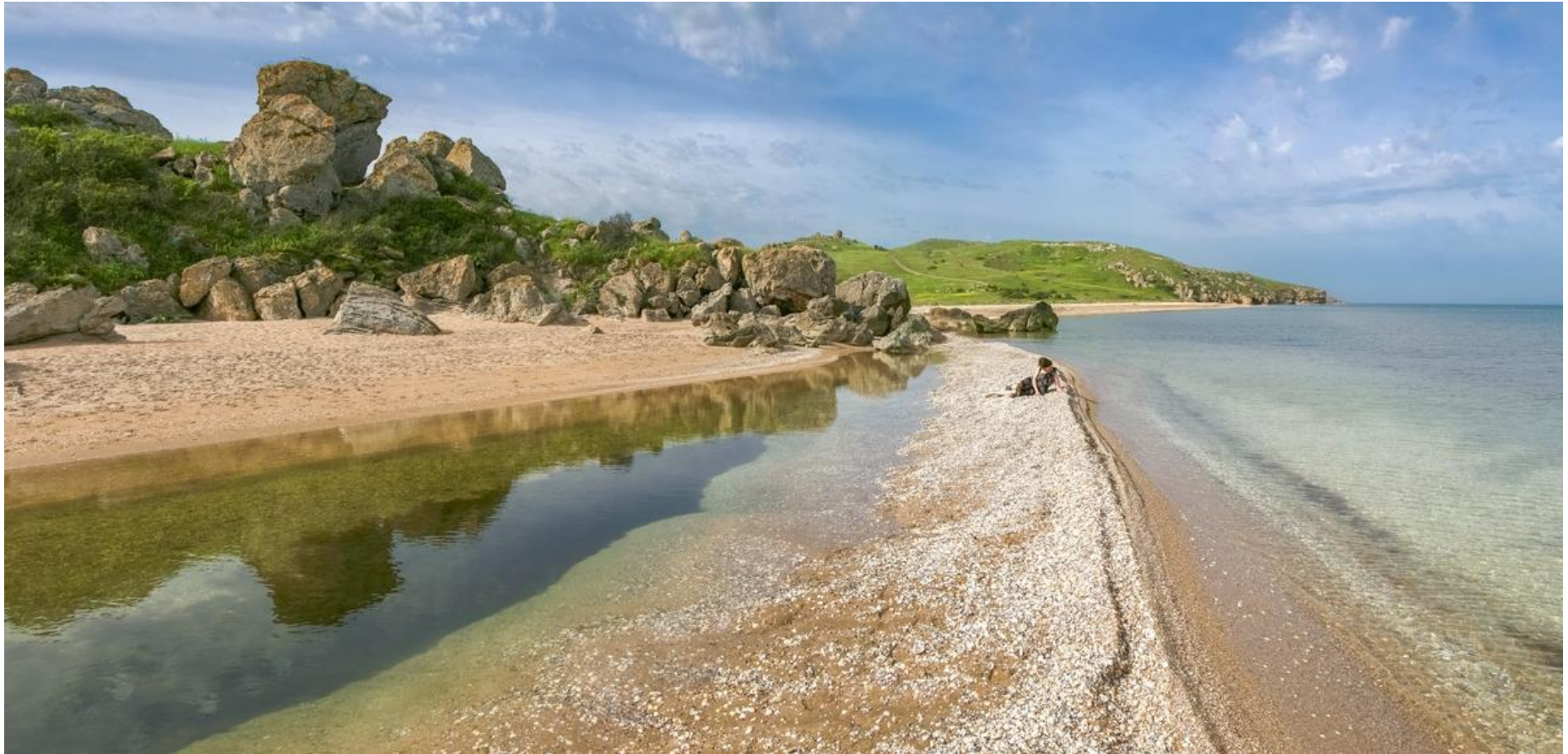
Побережье Азовского моря