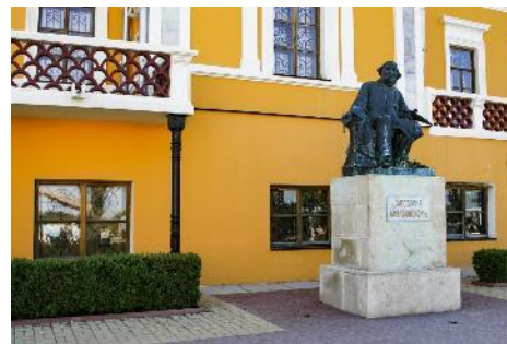
Картинная галерея Айвазовского