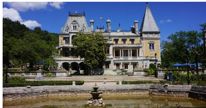
Массандровский дворец императора Александра III