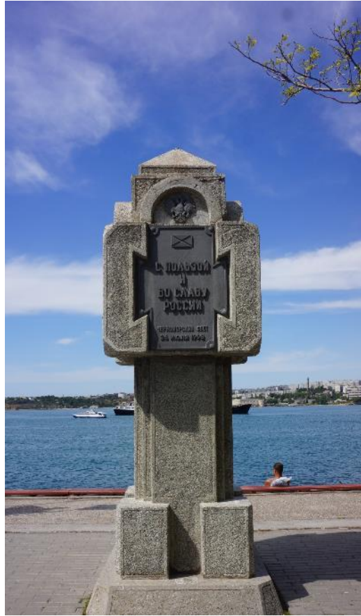
Севастополь город русской славы

По окончании маршрута в Феодосии, Ялте, Бахчисарае, Севастополе, Керчи, можно, задержавшись на пару дней, увидеть ещё много интересного