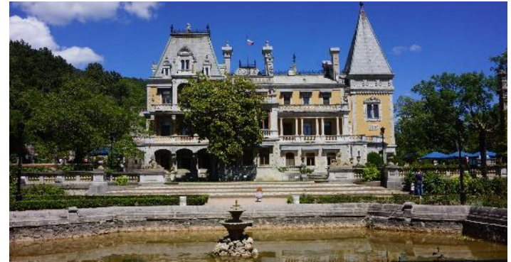
Массандровский дворец императора Александра III