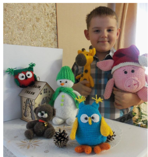
Это я и мои весёлые друзья.