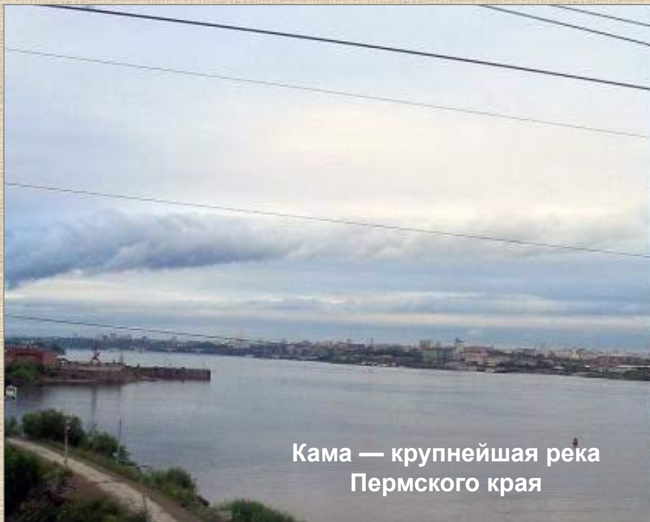
Кама — крупнейшая река Пермского края

Реки Пермского края относятся к бассейну реки Камы, крупнейшего левого притока Волги. В Пермском крае более 29 тысяч рек общей длиной свыше 90 тысяч километров.