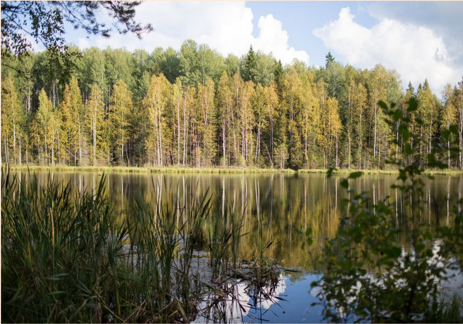
Место обитания лебедя – кликуна, занесённого в Красную книгу Удмуртии