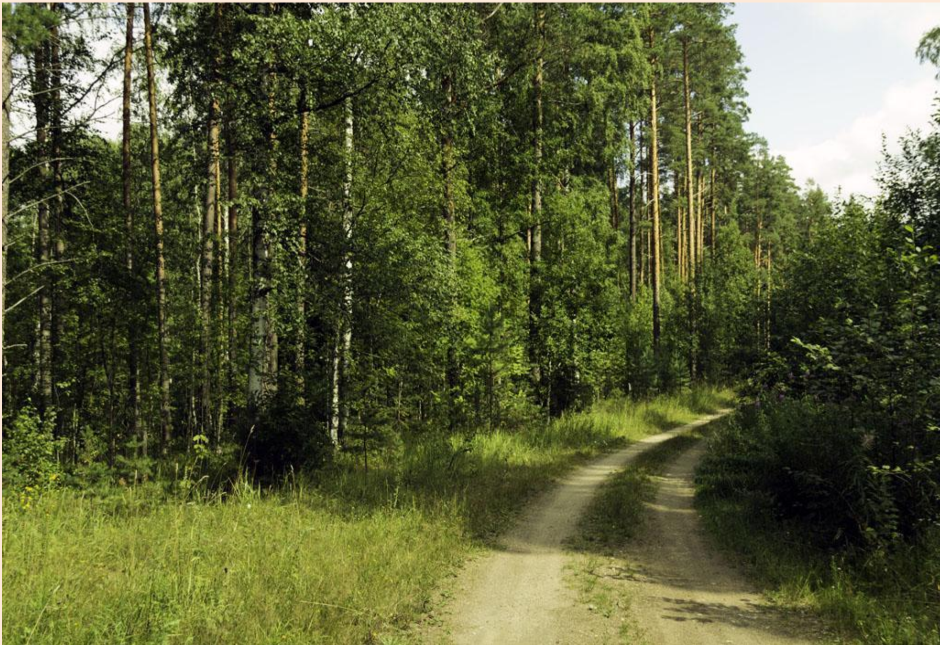
Дорога, убегающая в сосновый бор