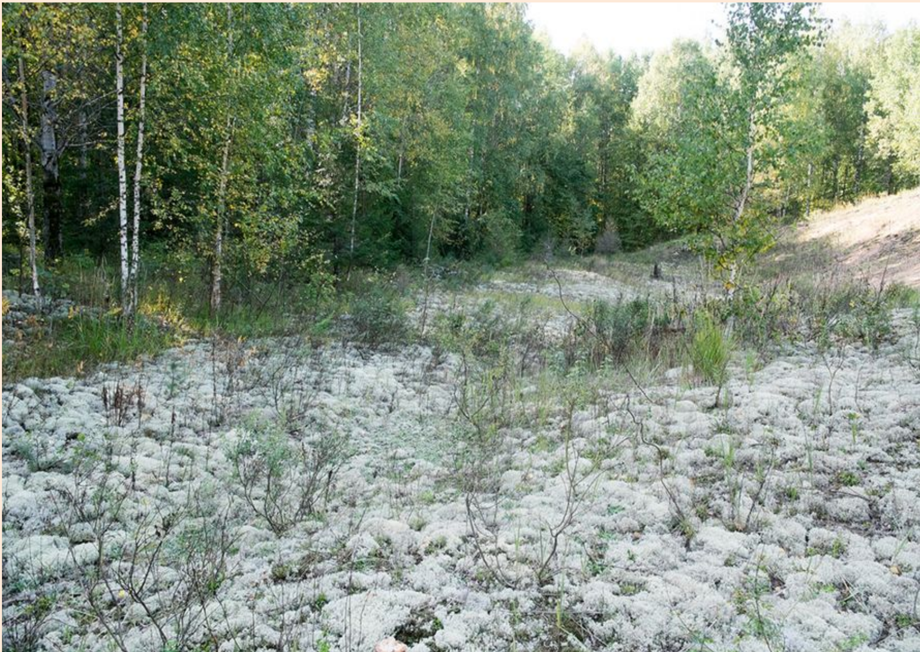
Визитная карточка Кабака - белый мох