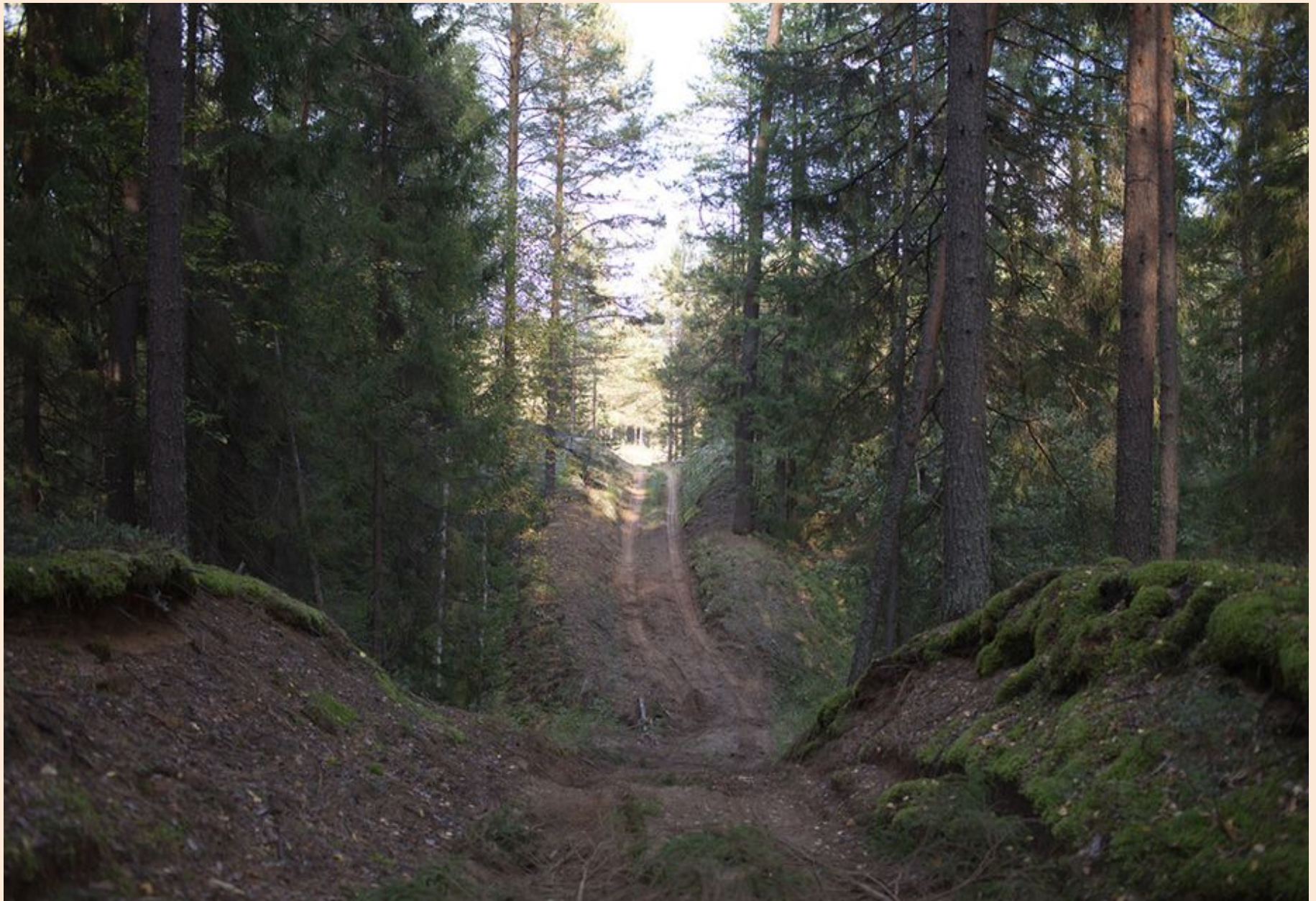
Территорию заказника украшают спелые сосновые боры с глухариными токами.