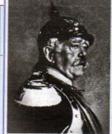
Отто Висмарк (1815—1898)

Его Величество Король Прусский, от имени Северо-Германского Союза, Его Величество Король Баварский, Его Величество Король Вюртембергский, Его Королевское Высочество великий герцог Баденский и Его Королевское Высочество великий герцог Гессенский, стоящий также во главе тех частей герцогства, которые расположены по Рейну к югу от Майна, заключаем вечный союз для защиты союзной территории и применяемого на её протяжении права, а также для обеспечения благосостояния немецкого народа. Этот союз будет именоваться Германской Империей германские государства вошли в состав Германской империи? Найдите их на карте.