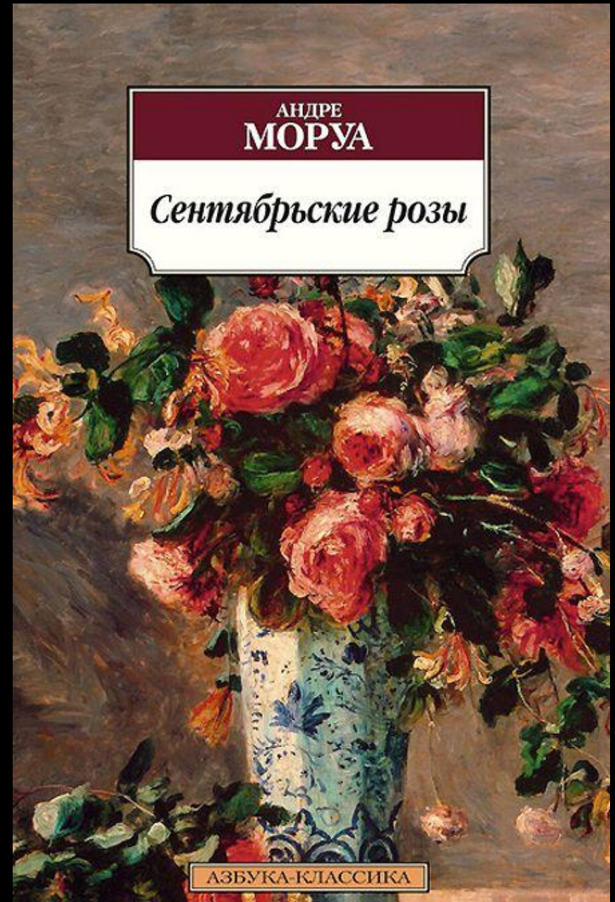
“Roses et jasmin” de Renoir