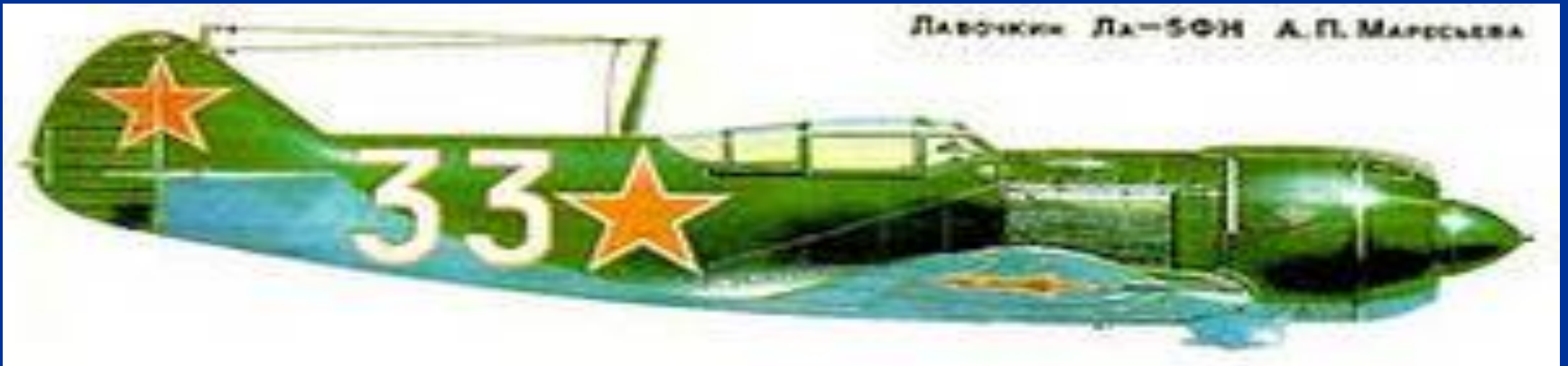
Лавочкин Ла-5ФН А.П. Маресьева