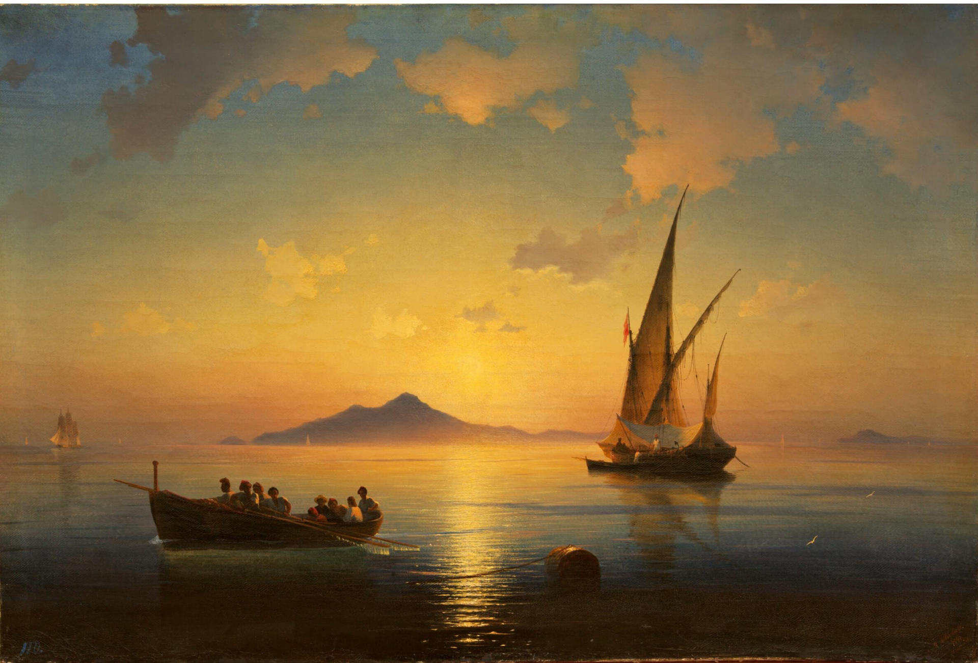
«Неаполитанский залив», Иван Айвазовский