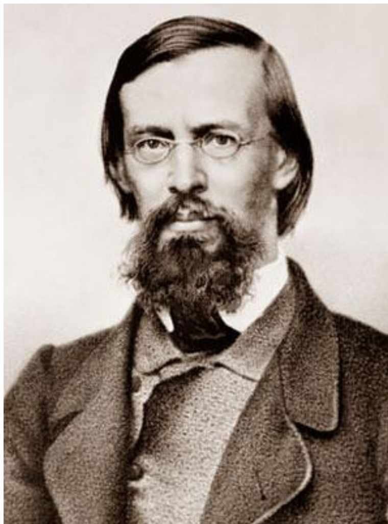
Аполлон Николаевич Майков (1821 - 1897)