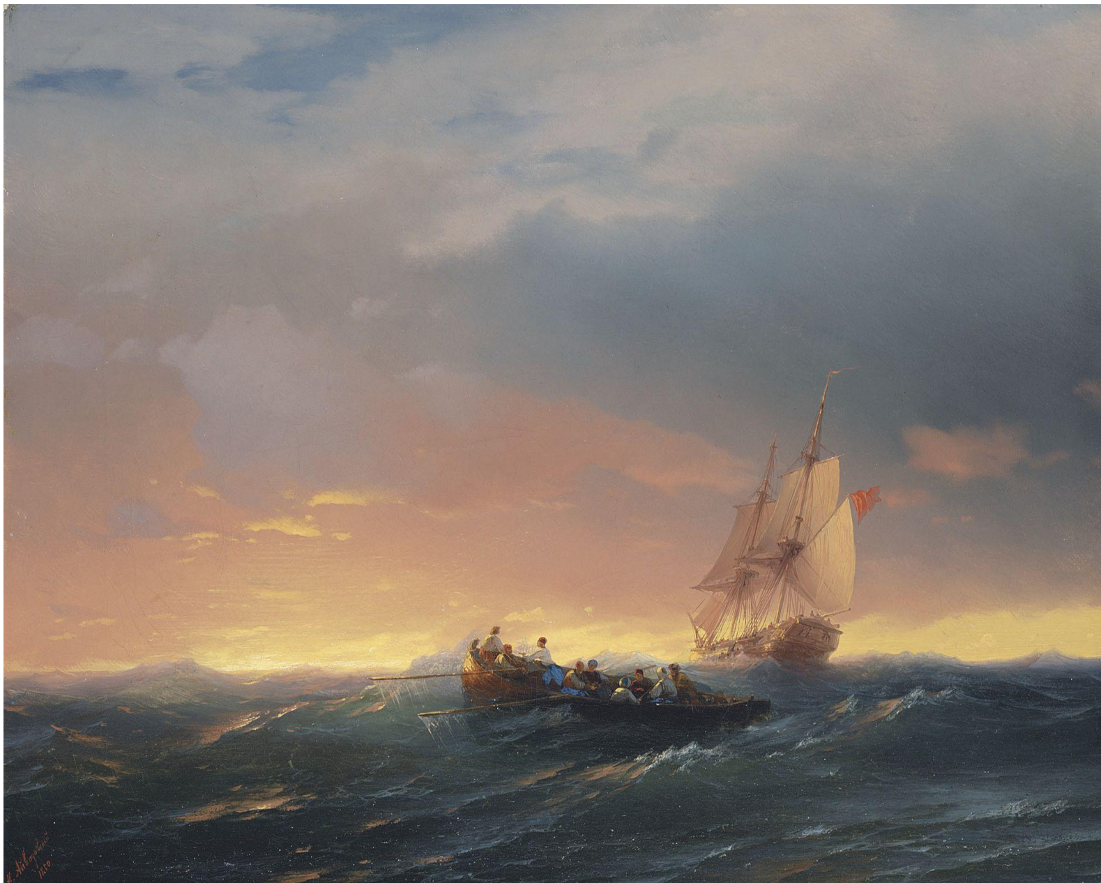
Иван Константинович Айвазовский «Суда, находящиеся в зыбь на закате»