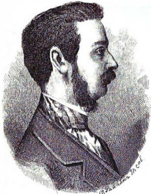
Валериан Николаевич Майков.