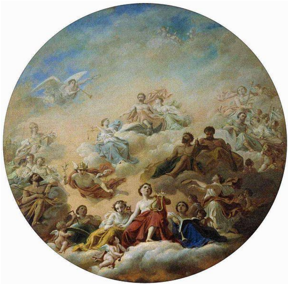
Н.А.Майков. «Олимп» ранее 1873