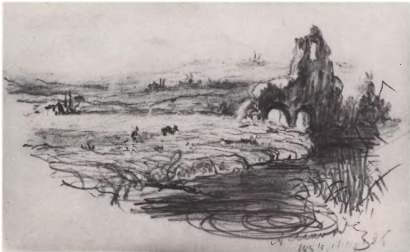
Пейзаж с руинами. 1854