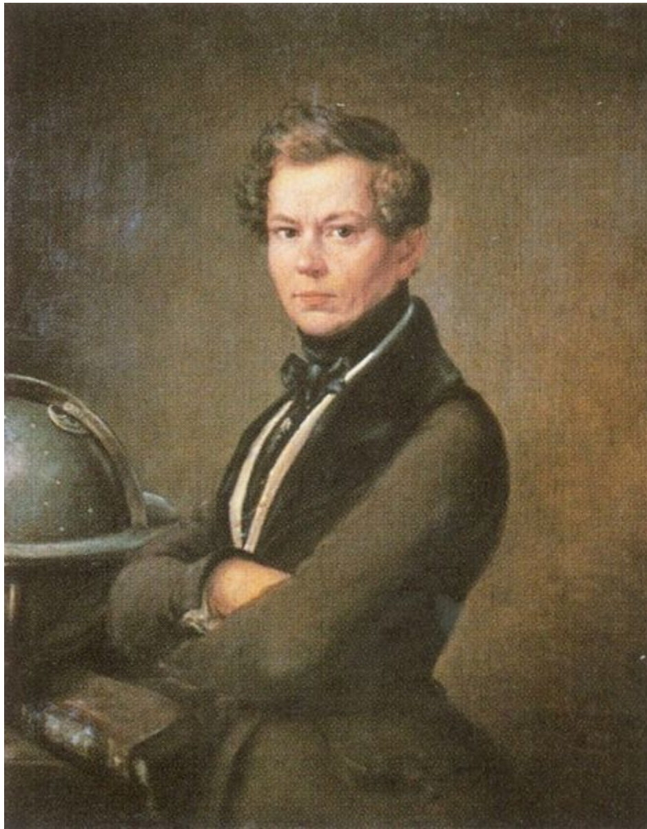
Н.А. Майков Портрет неизвестного астронома. 1830-е годы