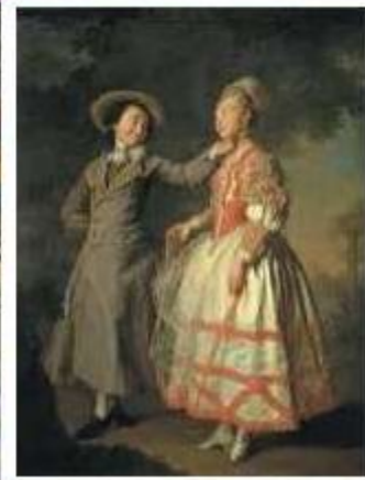
Левицкий Дмитрий Григорьевич Портреты воспитанниц