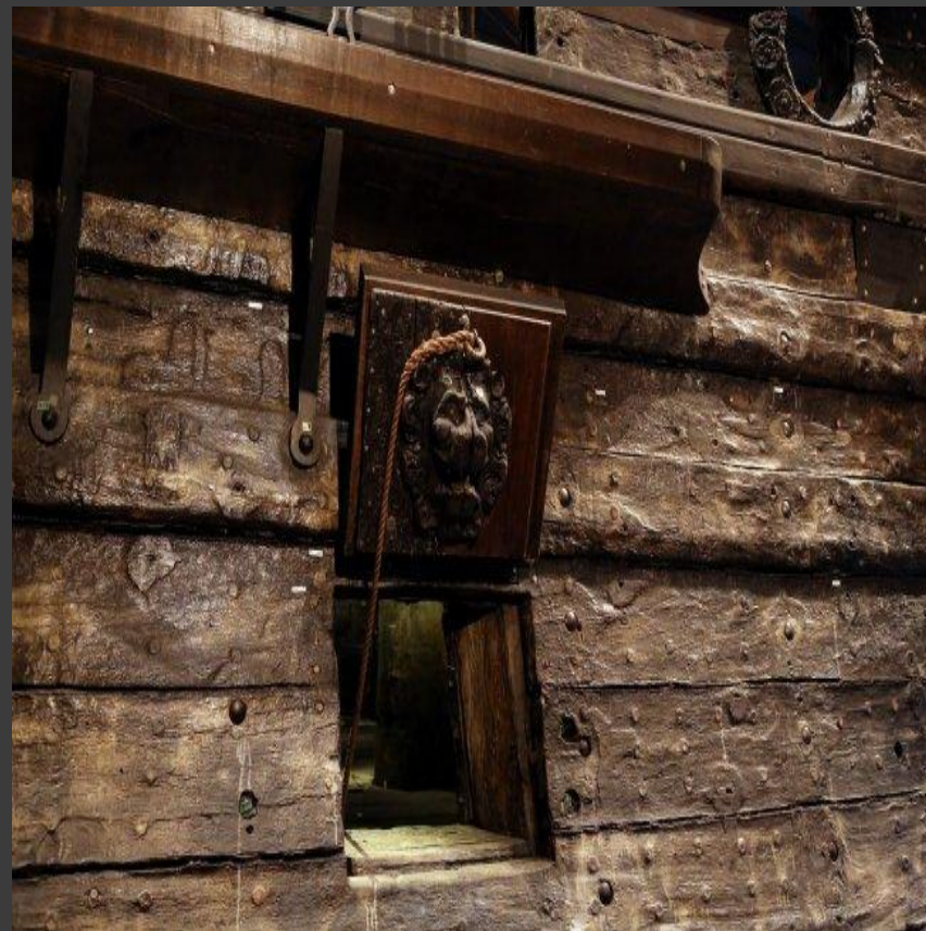
Порт для пушки