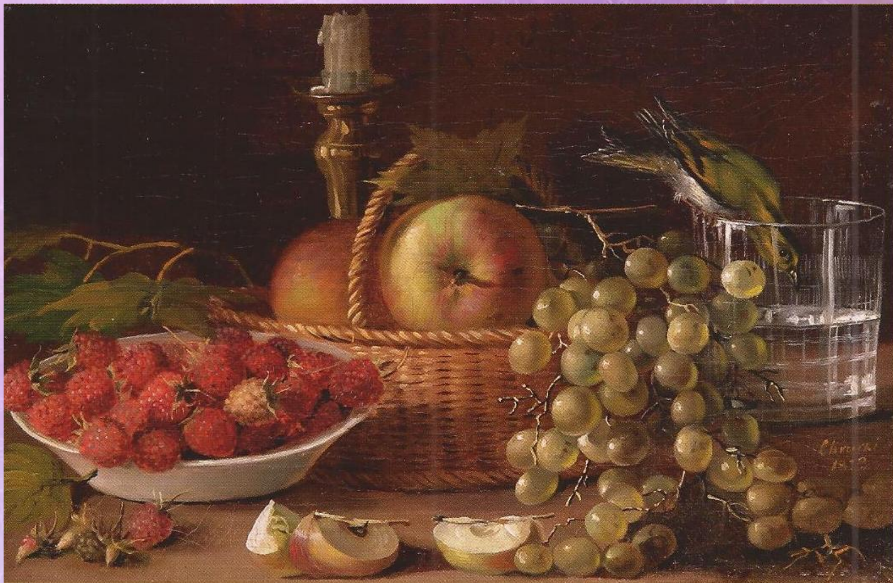
«Плоды и птичка» (1833)