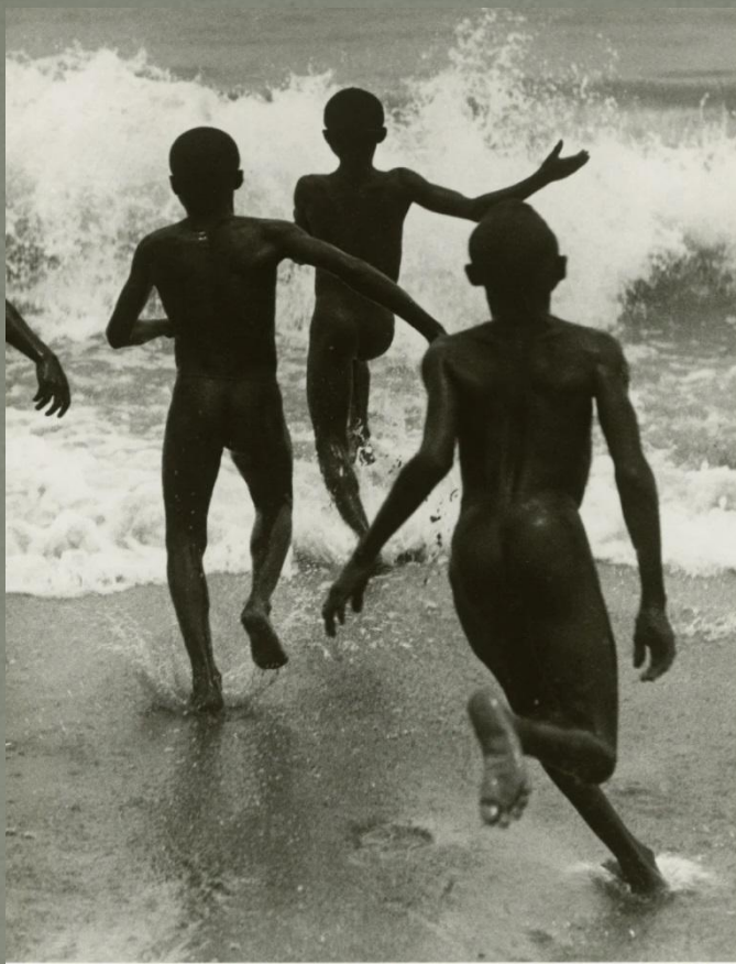
Три мальчика на озере Танганьика. 1930 год