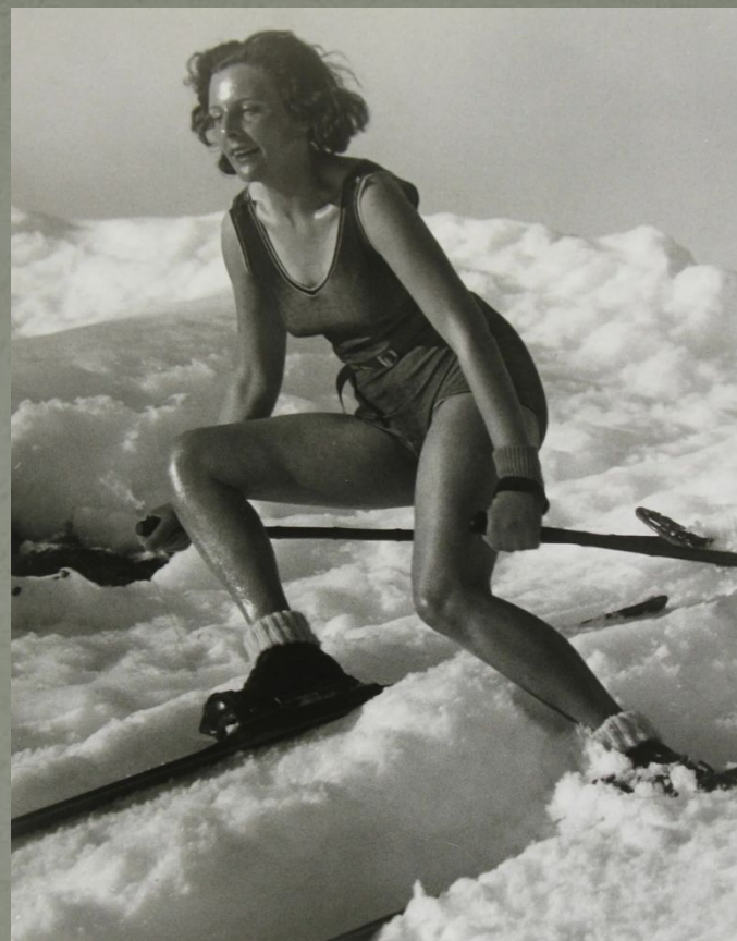
Лени Рифеншталь. 1931 год