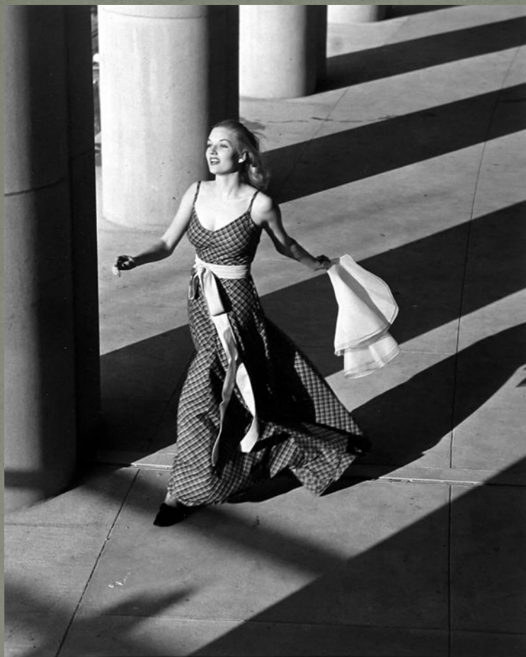
Летний вечер. 1930 год