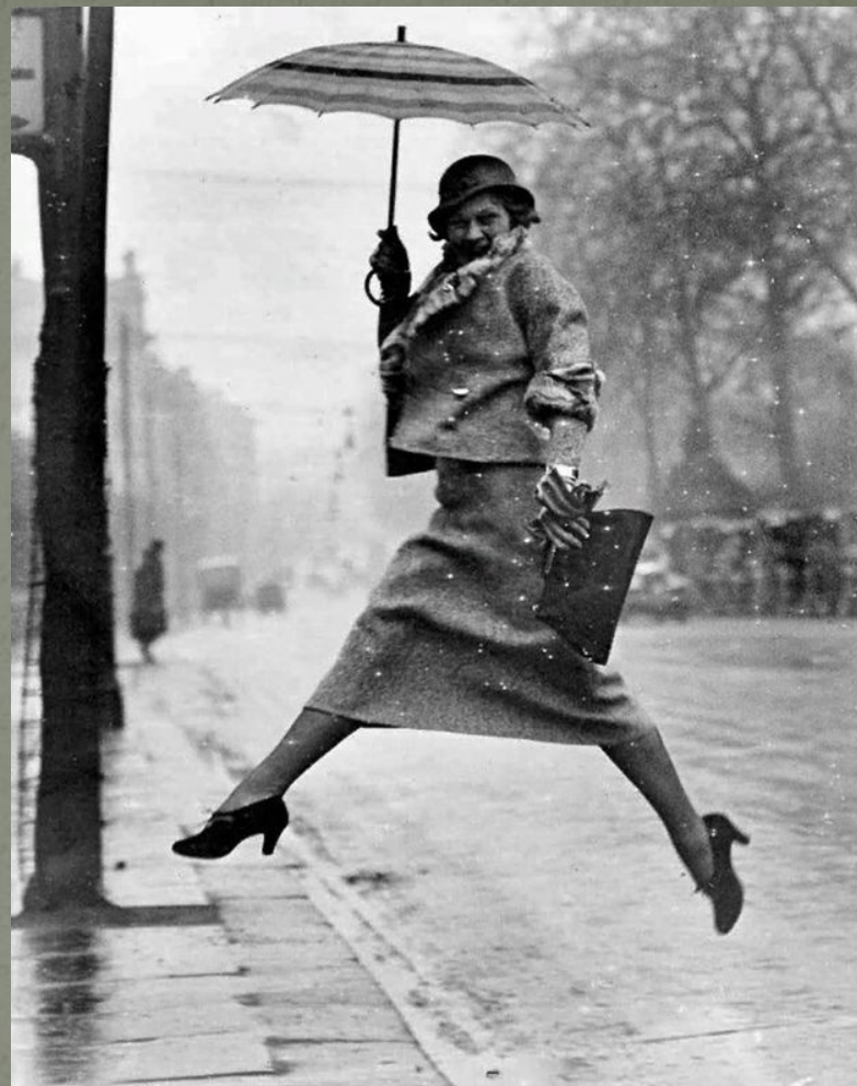
«Женщина с зонтиком» 1934 год