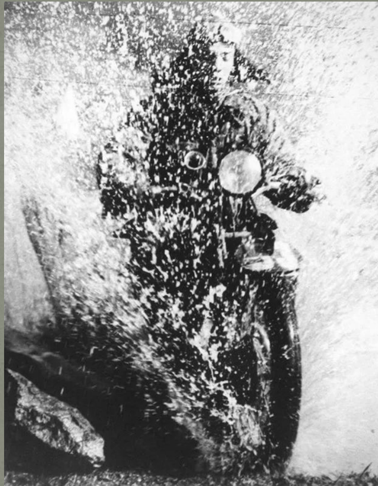
«Мужчина на мотоцикле» 1928 год