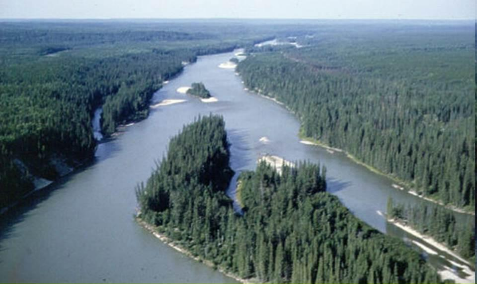
10. река Атабаска