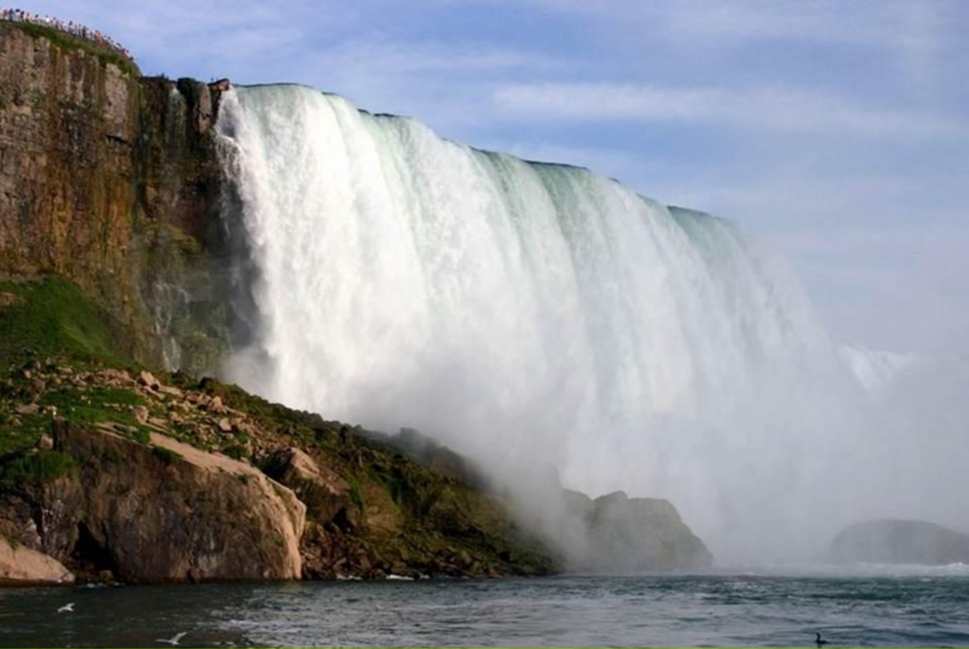
Ниагарский водопад. Высота 51 метр.