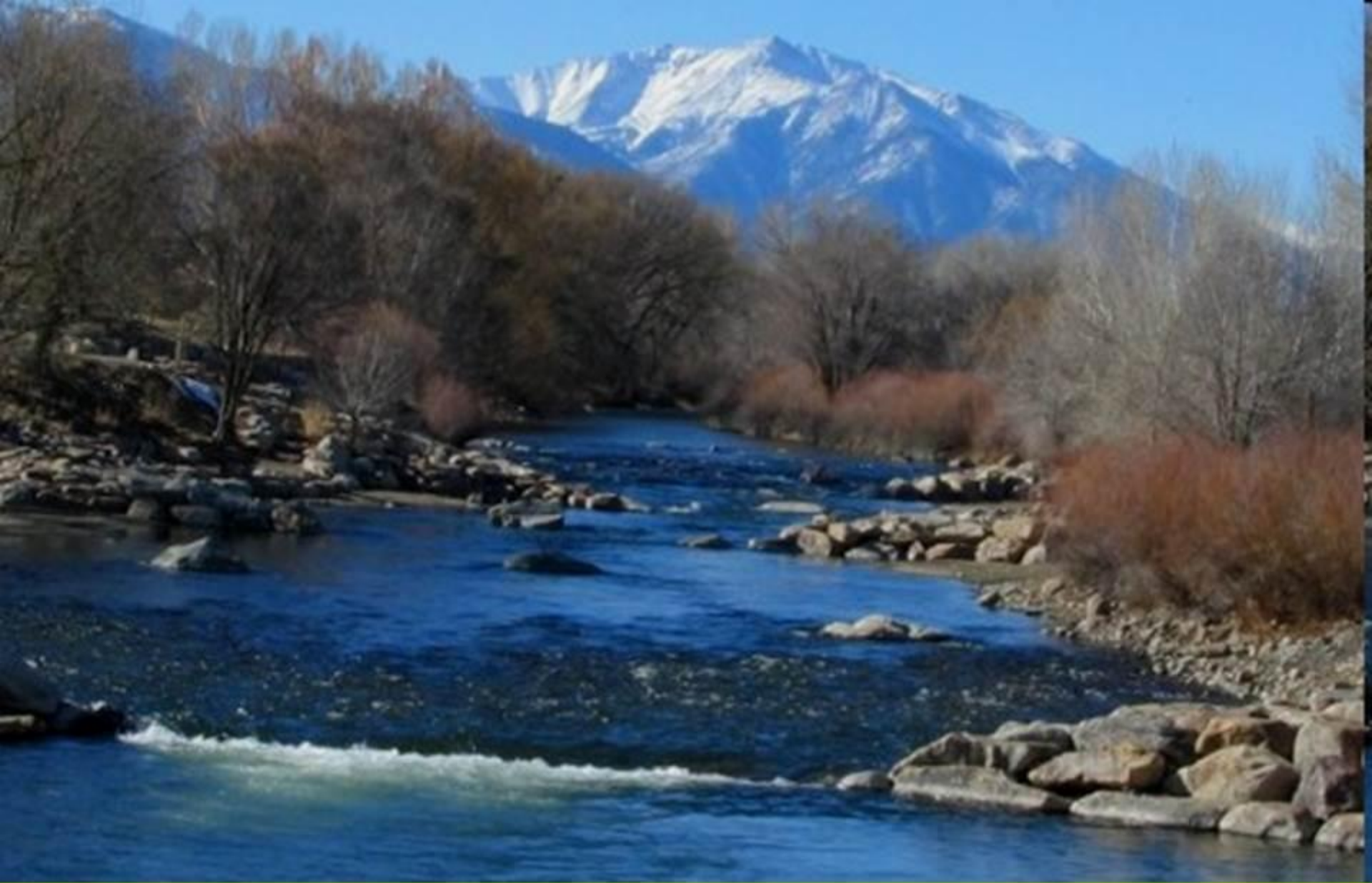
4. река Арканзас