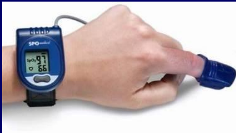
Компьютерный пульсоксиметр PulseOX 7500 (Израиль)

Компьютерная мониторинговая пульсоксиметрия – метод длительного мониторинга сатурации и пульса. Пульсоксиметр позволяет за 8 часов сна выполнить более 25000 измерений сатурации и сохранить полученные данные в памяти прибора