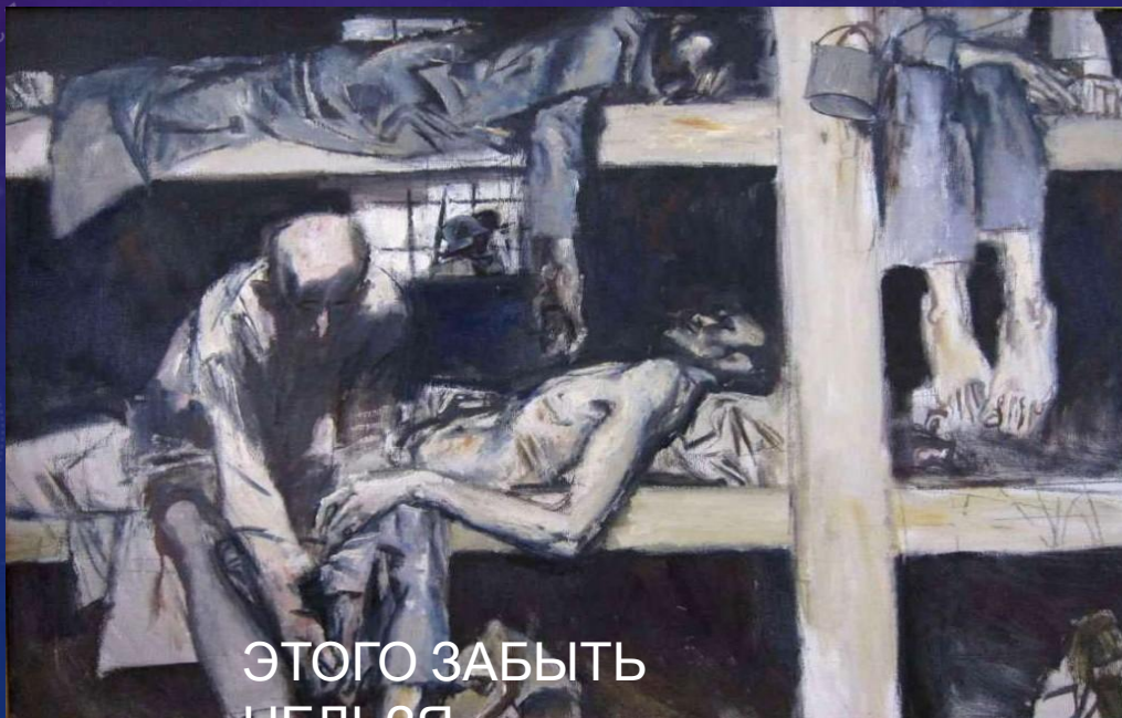
ЭТОГО ЗАБЫТЬ НЕЛЬЗЯ