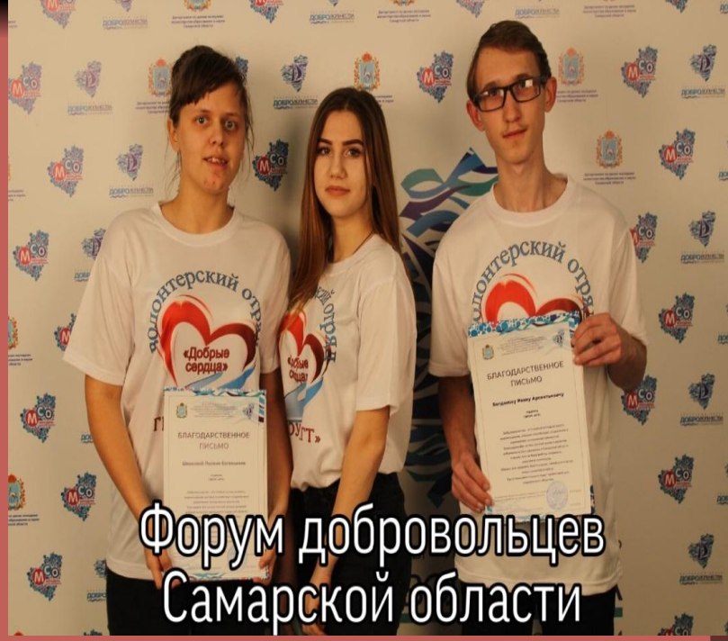
Форум добровольцев Самарской области