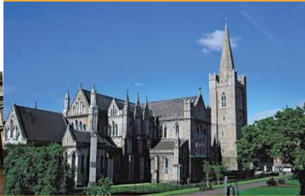
Собор святого Патрика