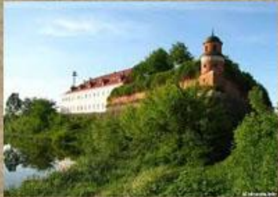
Фортеця у Дубно