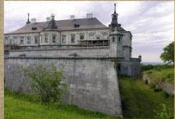
Замок у Підгірцях