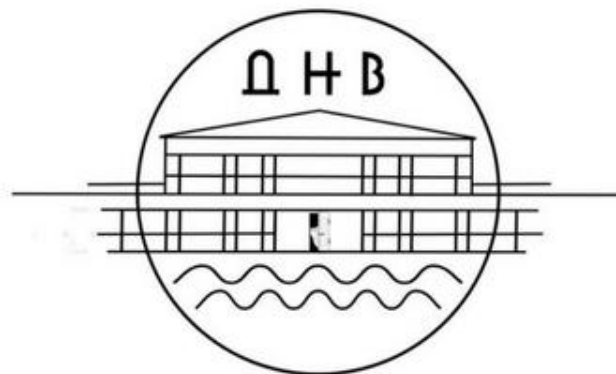
Дом на Воде