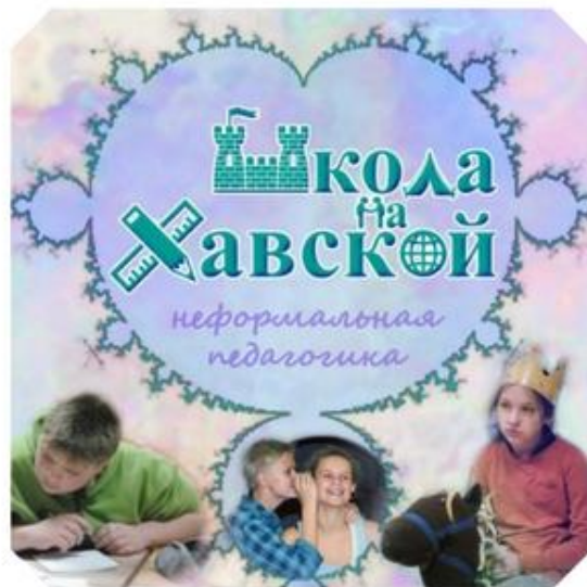
Центр альтернативного образования Школа на Хавской