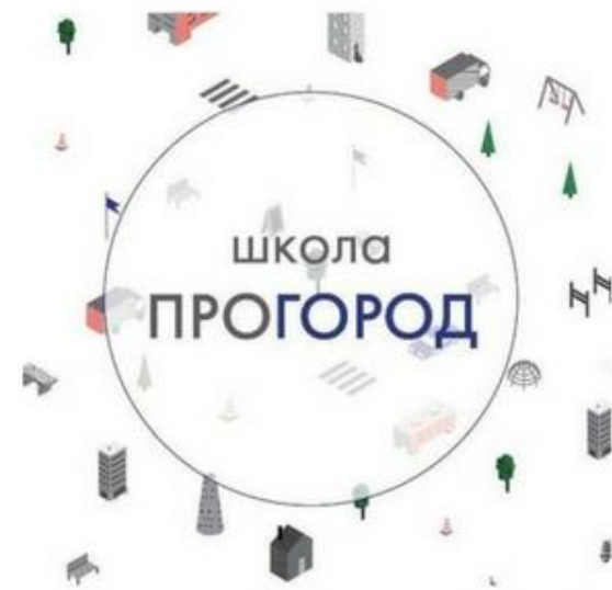
Урбанистическая Школа ПроГород