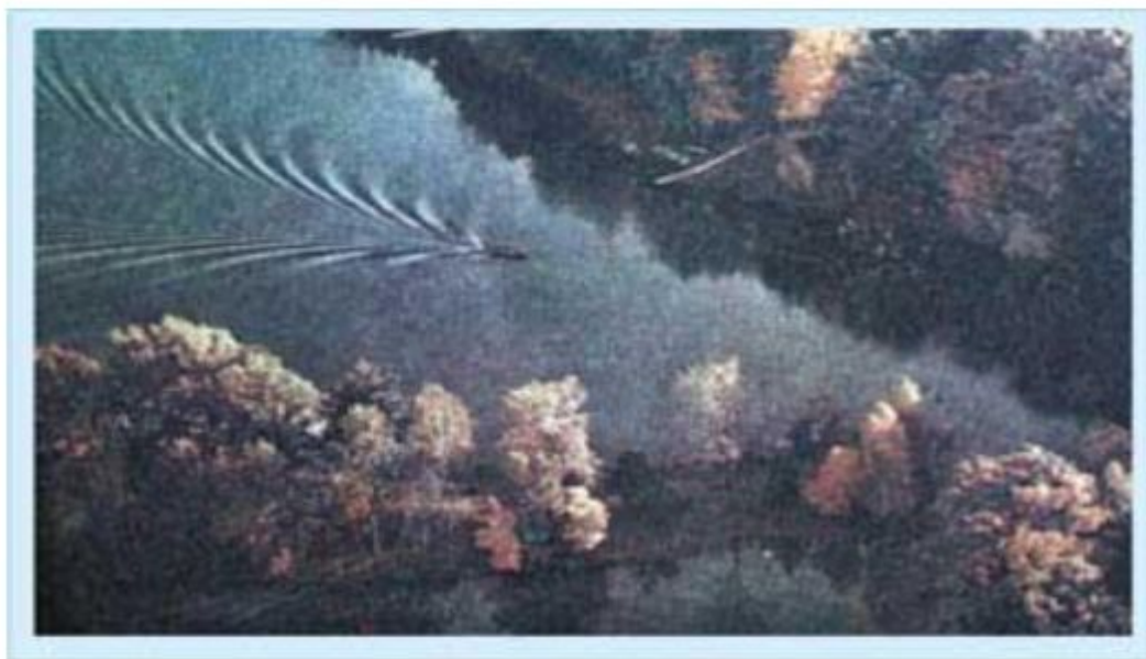
Вот как порой проявляется простота. (Уильям Гэрнетт) [П.Эткинс, Порядок и беспорядок в природе, 1987, стр. 199].

Первым сформулированным принципом теории самоорганизации является принцип древнекитайской философии «ли» - принцип естественного порядка.