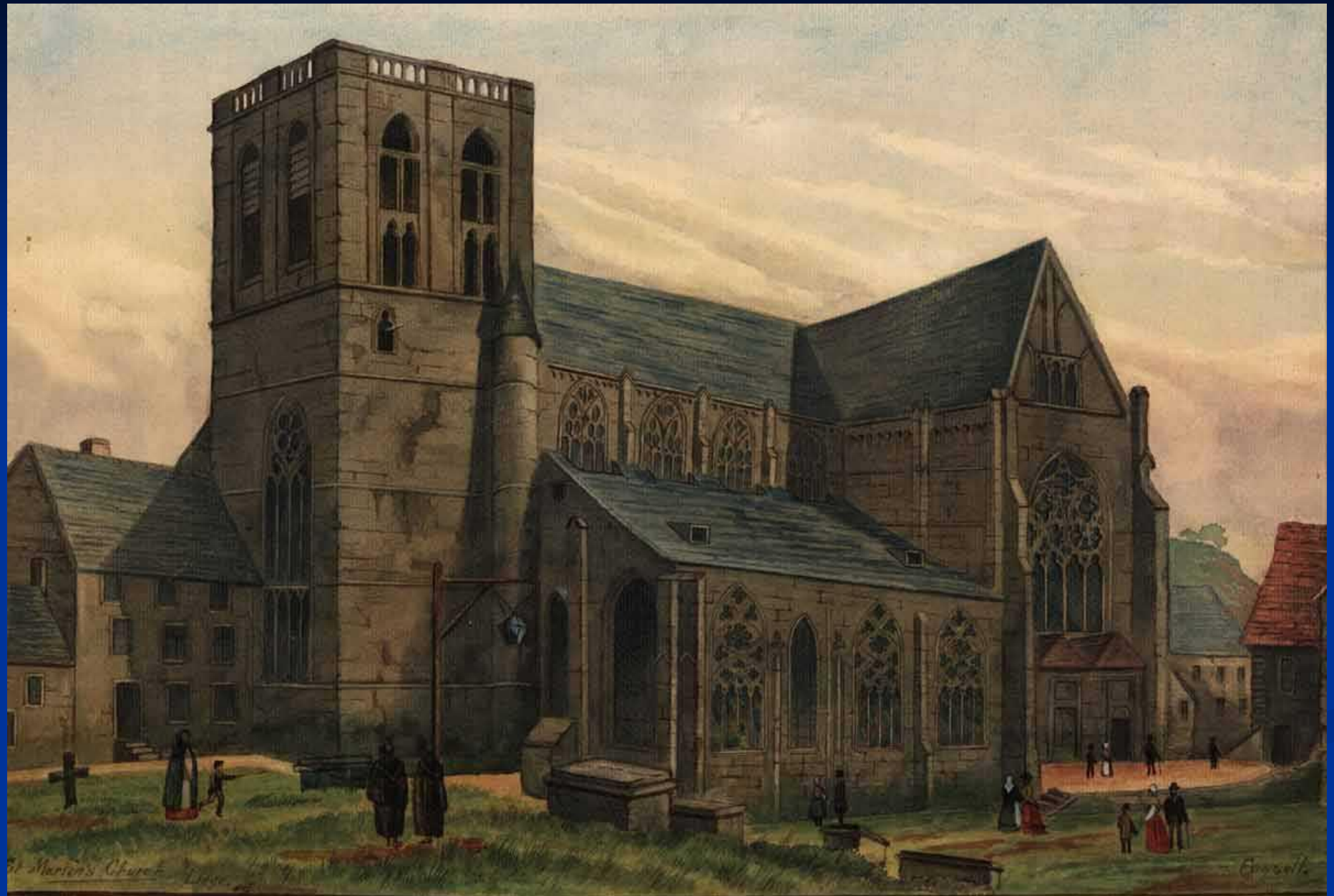
St. Martin's Church