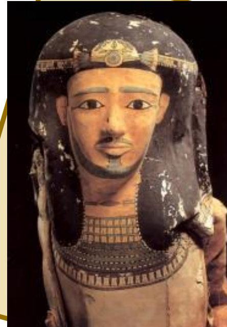
Маска мумии вельможи