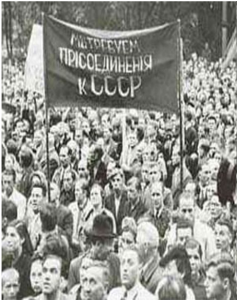
Митинги в Прибалтике с требованием присоединения к СССР.

Возникшие в Эстонии, Латвии и Литве «народные правительства» вскоре обратились к Советскому Союзу с просьбой о вхождении в состав СССР в качестве союзных республик.