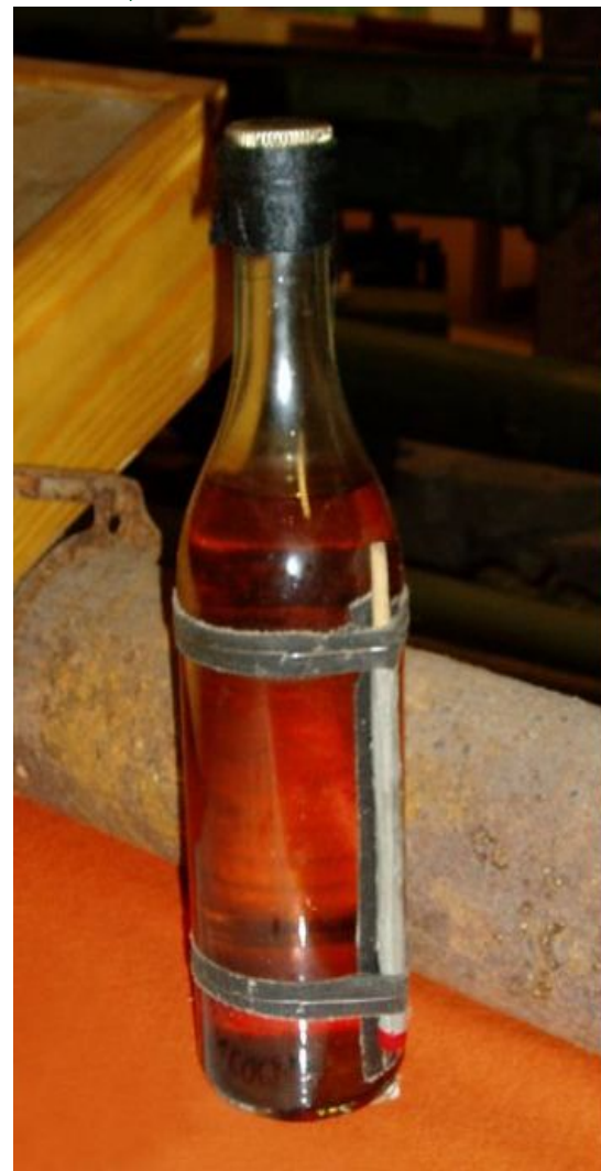
Бутылка с зажигательной смесью времен «Зимней войны»