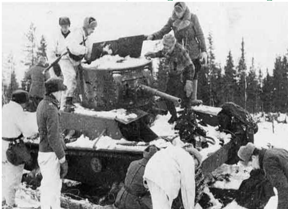
Подбитый советский танк Т-26