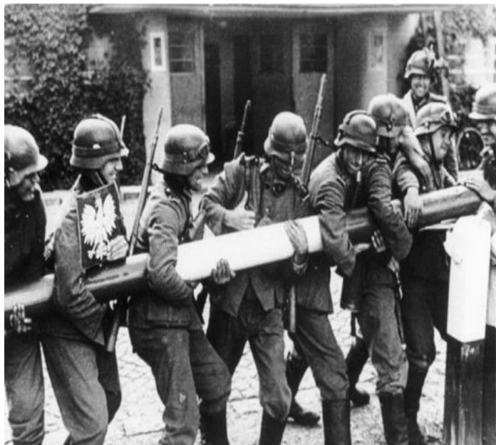
1. September 1939

Польские войска были быстро разбиты, правительство бежало из столицы.