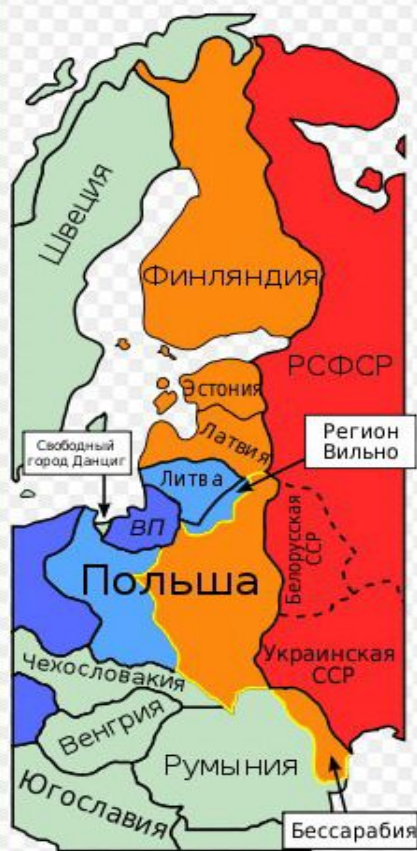
Действительные территориальные изменения в 1939 — 1940