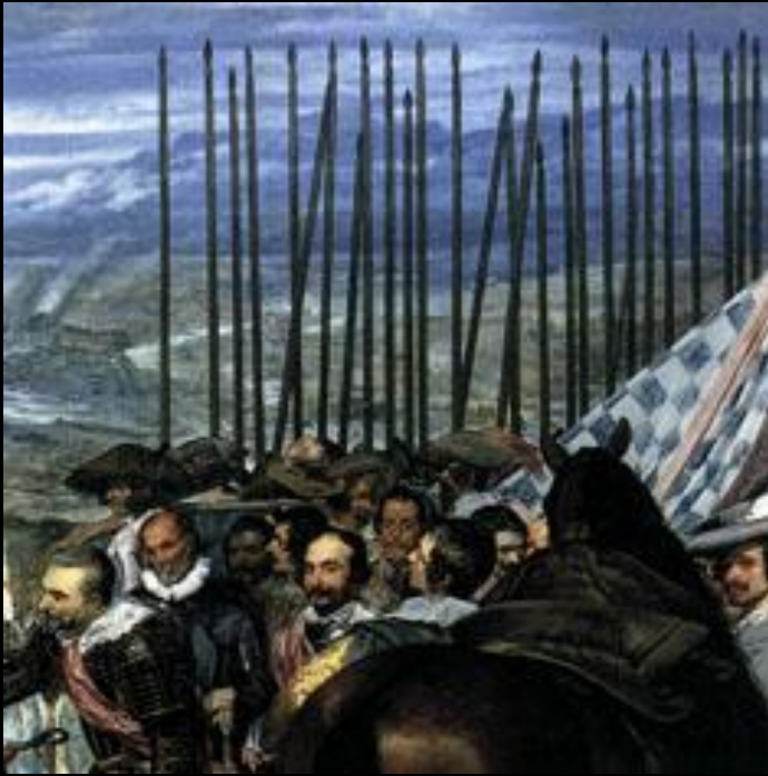
Сдача Бреды. Фрагмент

Второе название картины – «Копья». Почти треть холста занята изображением длинных острых копий, или пик, являвшихся на протяжении многих столетий символом военной силы Испании.