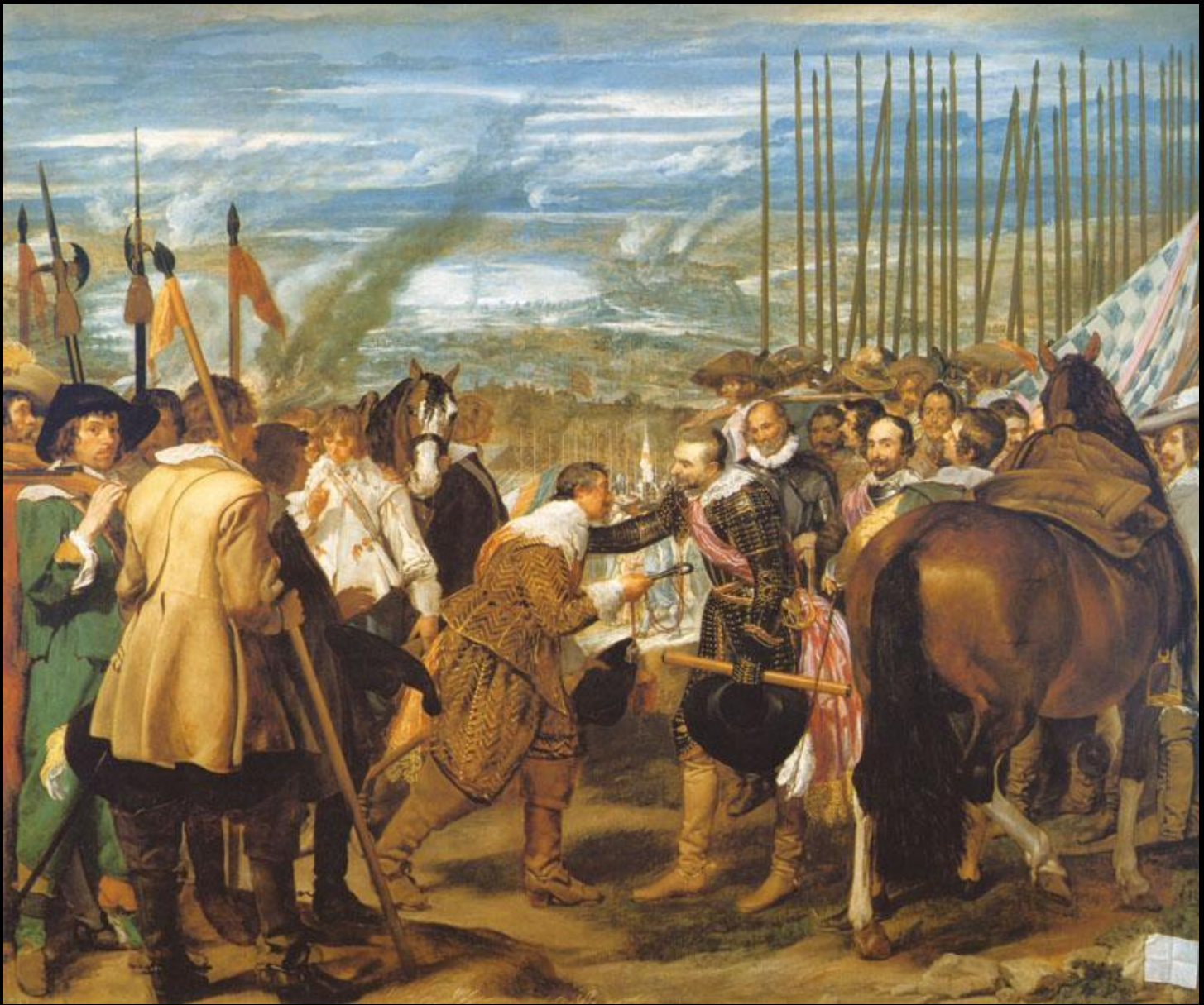
Д. Веласкес. Сдача Бреды. 1634–1635. Музей Прадо, Мадрид