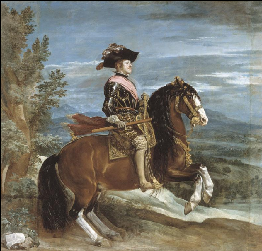
Д. Веласкес. Филипп IV на лошади. 1631–1636

Двенадцать месяцев провели испанцы у стен крепости, отражая атаки голландцев и страдая от эпидемий, неизбежных в этой болотистой местности.