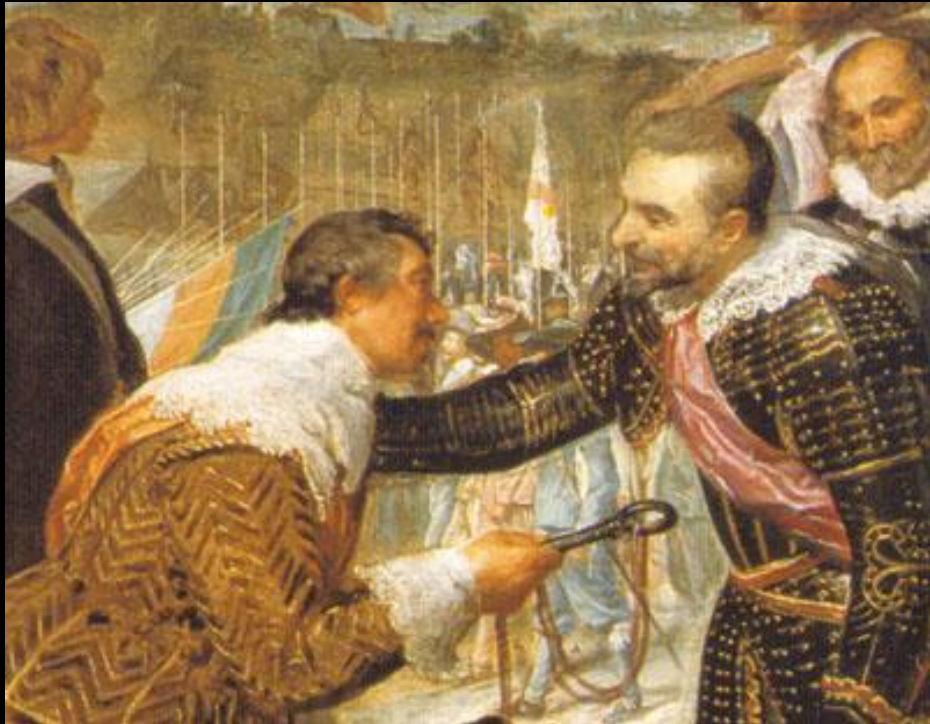
Сдача Бреды. Фрагмент

На полотне запечатлен символический момент передачи ключей от города, встреча бывших противников, что позволило художнику сосредоточиться на сложной гамме эмоций победителей и побежденных, невероятной смеси великодушия и высокомерия.