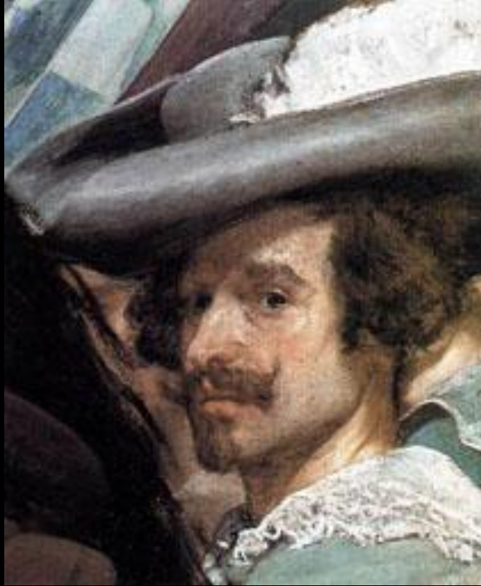
Сдача Бреды. Фрагмент