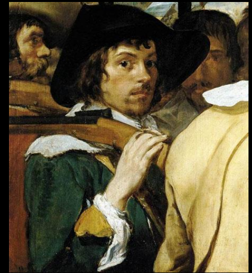
Сдача Бреды. Фрагменты