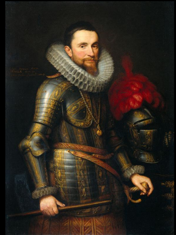
М. ван Миревельт. Портрет Амброджо Спинолы (1569–1630). 1609

В 1624 г. главнокомандующий испанскими войсками в Нидерландах Амброджо Спинола по приказу короля осадил город-крепость Бреду, важнейший стратегический бастион Голландии.