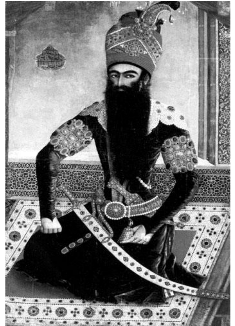
Аббас I Великий – персидский шах

1594 г. - беспошлинная торговля между Россией и Персией. Выгодный союз против Османской империи. Успешное развитие отношений между Россией и Персией.