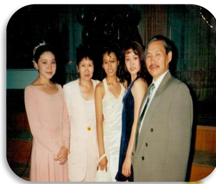
Қызы Гүлжахан /дүниеден өткен/