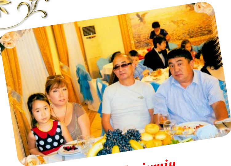
Ұлы Серіктің отбасымен