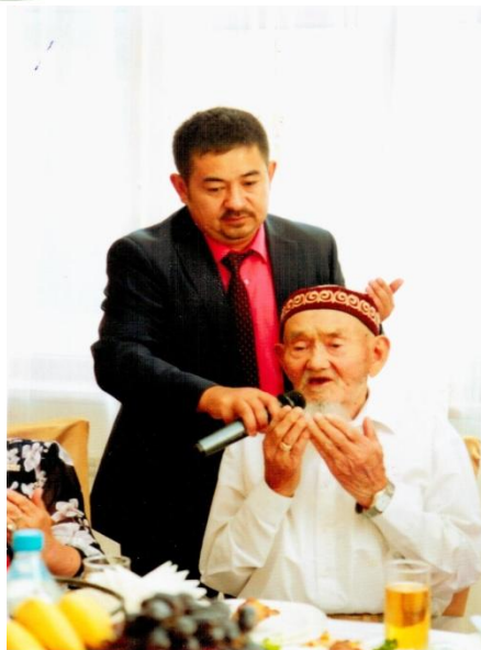
Мамтықтық пен өзіндік өмір сүру сағаты