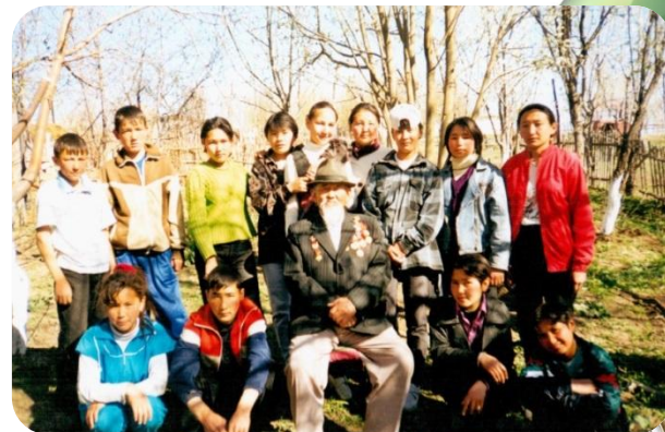
Мектеп оқушылары арасында