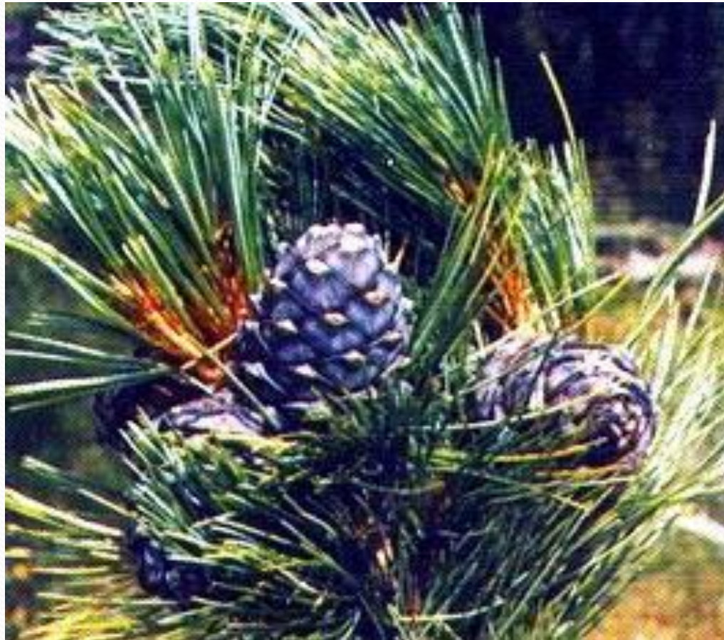
Кедровая сибирская сосна