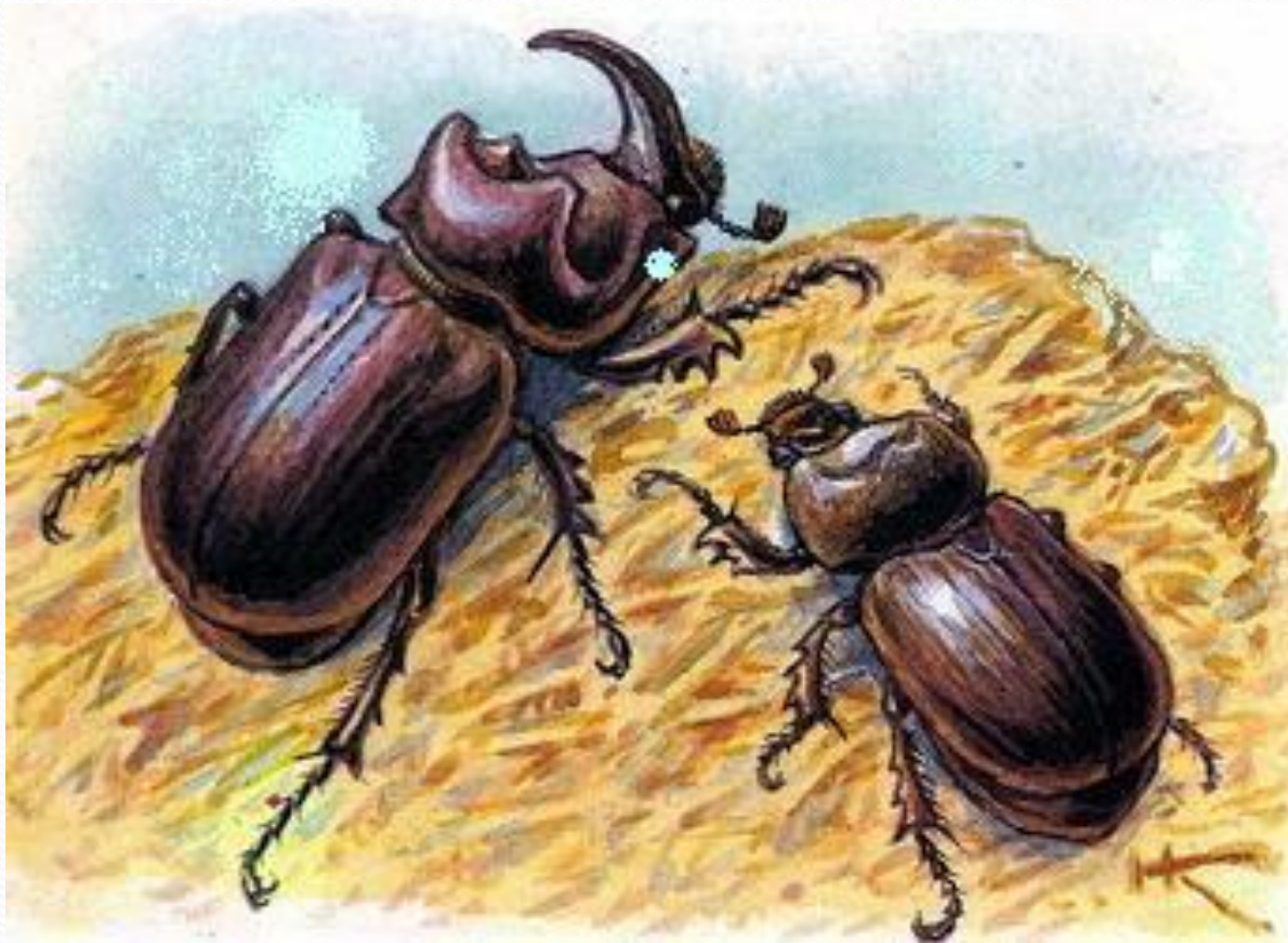
Жук носорог обыкновенный