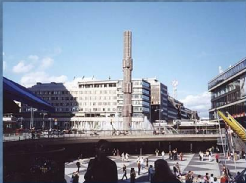
Главная улица города — Кунгсгатан (Королевская).

Лежащий на северном берегу протока Норстрем район Нормальм («Северное предместье») служит главным административным, торговым и культурным центром столицы. Здесь расположены новое здание риксдага, правления крупнейших банков и промышленных концернов, большие универмаги, гостиницы и рестораны, оперный и драматический театры, центральный вокзал, многоэтажные жилые дома.