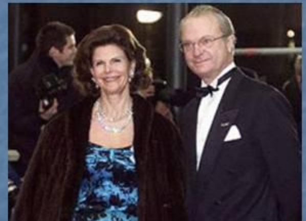
Королева Сильвия и король Карл XVI Густав