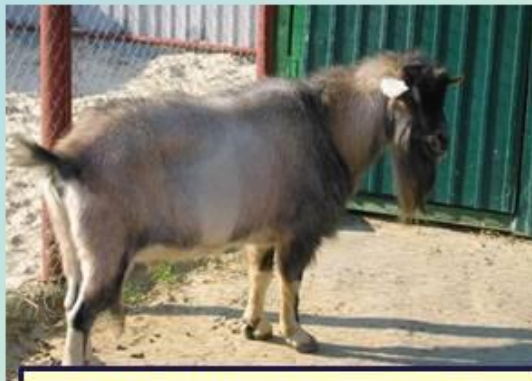
Домашняя пуховая коза