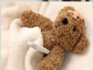
помощь при болезнях