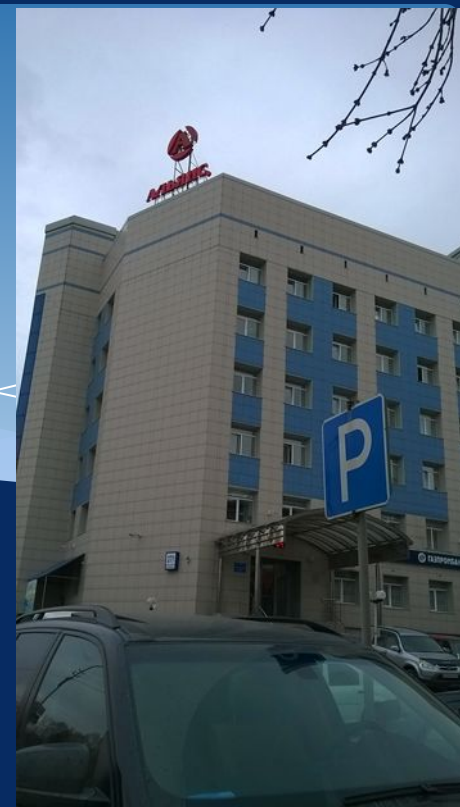
Газпромбанк И банк Альянс