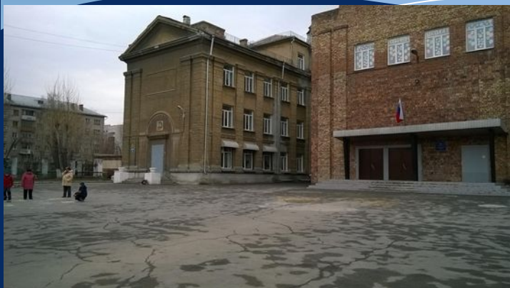
№ 27 Средняя Школа