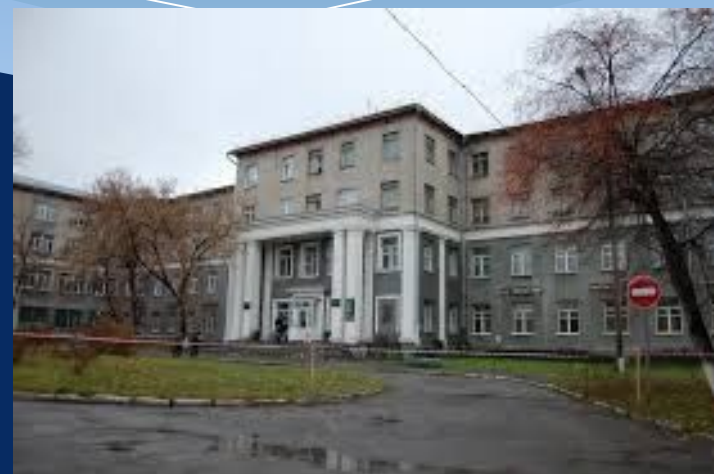
Городская клиническая больница № 34