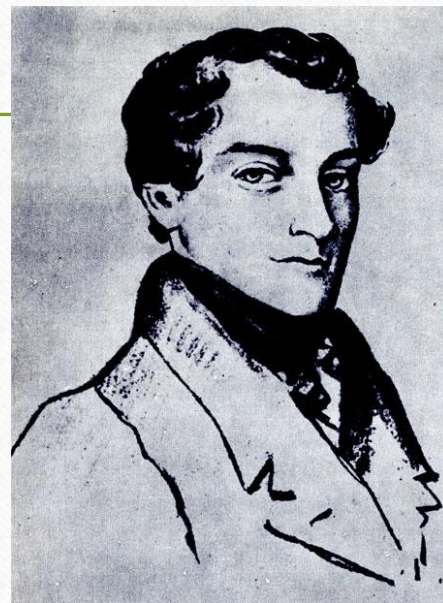
К. Ф. Рылов