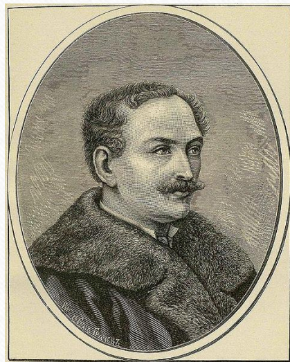
А. И. Одоевский